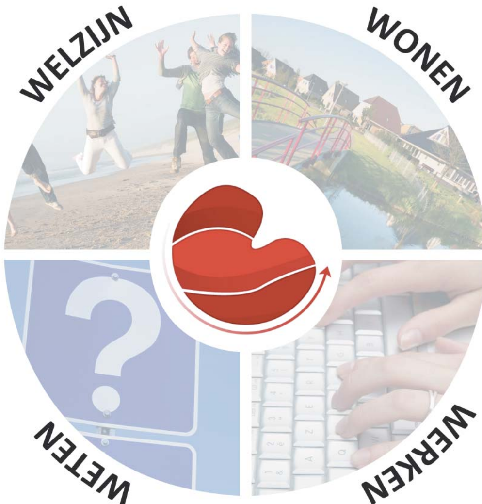
Fig. II.1 Format van de schijf

In fig. II.1 is een schijf weergegeven. Per gemeente worden er drie pizza's gemaakt. Hierin staan de positieve en negatieve aspecten, genoemd door de jongeren. De derde pizza bevat de wensen van de jongeren.