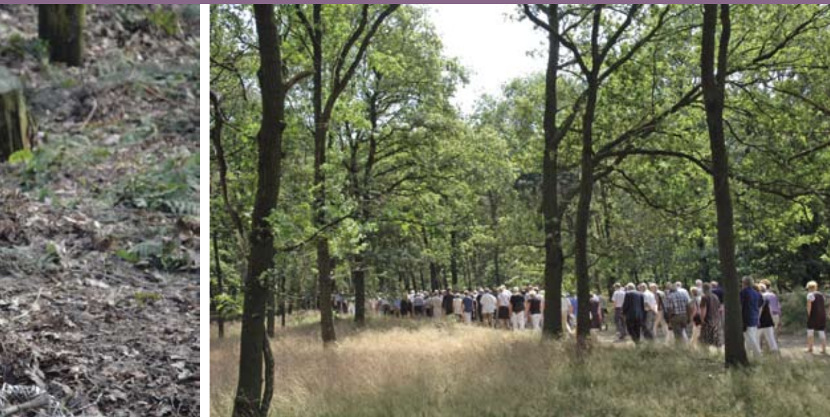
Linkerpagina: Natuurlijke bospaden voeren naar de graven. Alleen houten grafmonumenten zijn toegestaan. Boven: Een begrafenisstoet trekt ingetogen door de natuur.