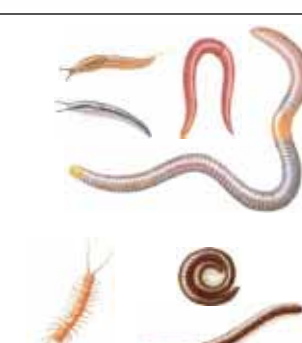
Stekken en regenwormen