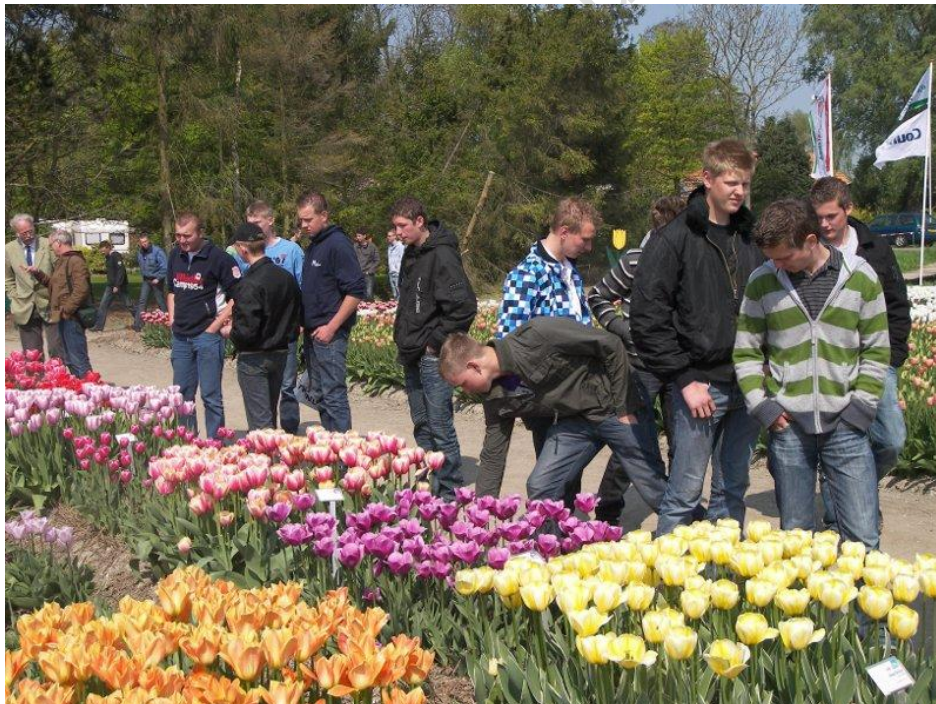
Landelijke leerlingendag Bloembollenacademie