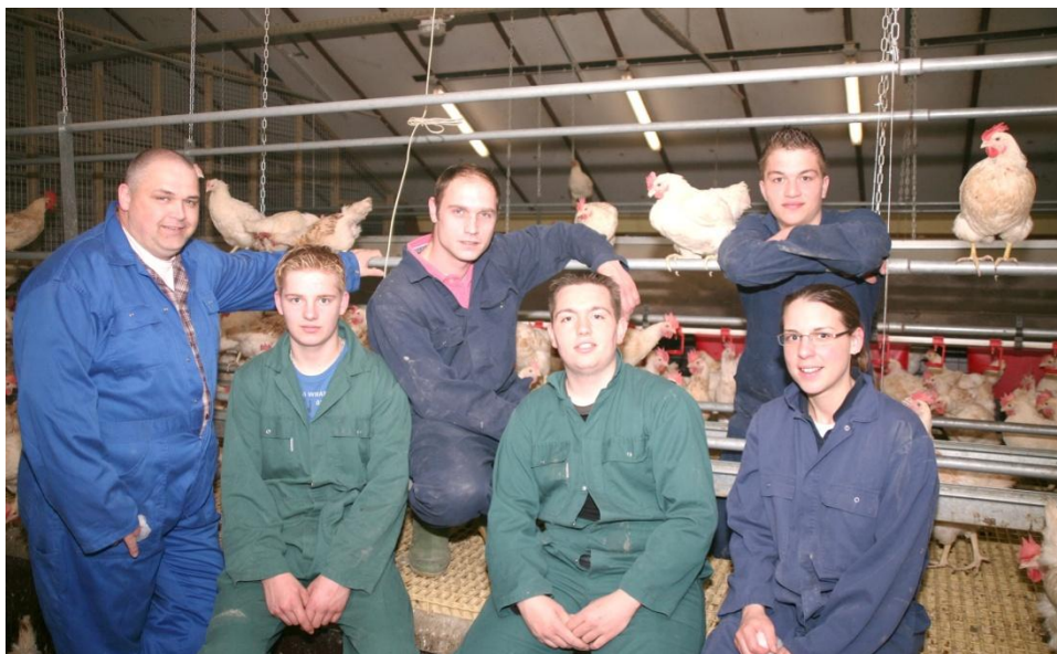
BBL Pluimveehouderij Cursisten 2009