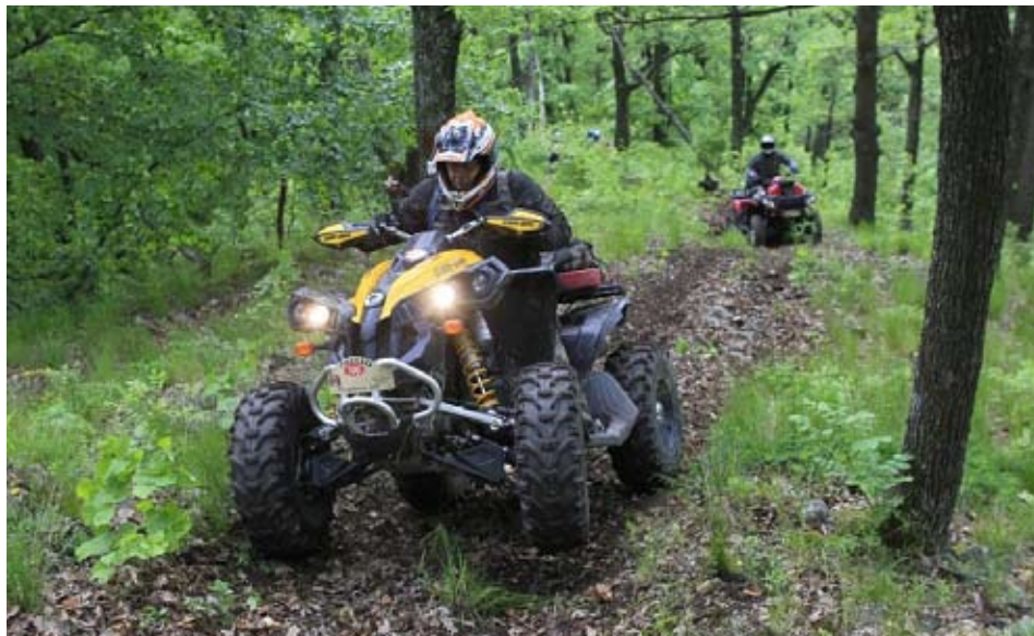
Quads zorgen in België al voor veel problemen. Gaat dat in Nederland ook gebeuren?

Deze van oorsprong Canadese uitvinding begon in de loop van de jaren tachtig in populariteit toe te nemen. De quad werd tot dan toe vooral gebruikt in de Canadese en Amerikaanse land- en bosbouw. Pas sinds het begin van de 21e eeuw wint de quad ook terrein in Europa. De hoofdfunctie van het voertuig is dan inmiddels verschoven van werkvoertuig naar recreatief voertuig. Er