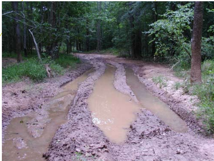
Quads kunnen veel grond verplaatsen, waardoor diepe sporen kunnen ontstaan.

In het artikel van de Belgische Bosrevue spreekt men van een "booming new sport" en "het in groten getale opduiken van quads". De conclusie die we aan de hand van dit verkennende onderzoek kunnen trekken is dat dit wat betreft quads in Nederland nog niet het geval is. Maar toch is het belangrijk om de 'vinger aan de pols' te houden, want problemen zijn in een vroeg stadium vaak veel efficiënter en effectiever op te lossen. Ons advies is dus om niet te wachten tot het probleem urgent is, maar al in een vroeg stadium samen met quadrijders, -fabrikanten en -verkopers om de tafel te gaan zitten om mogelijke problemen te voorkomen!