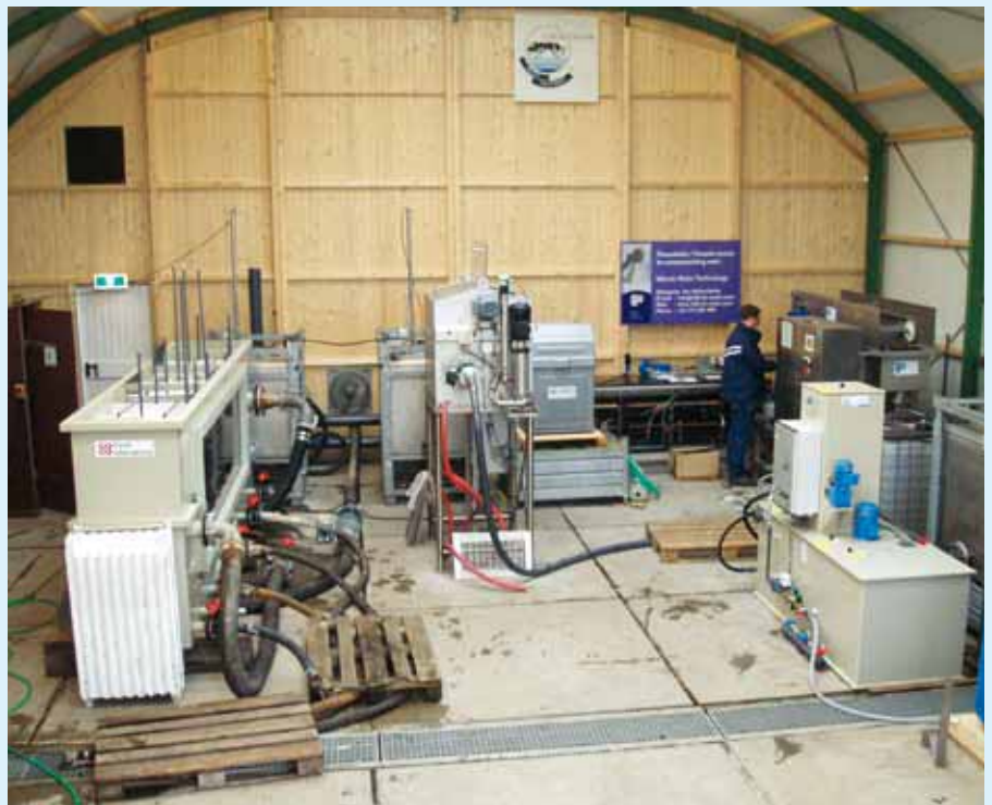
De proefhal voor het pilotonderzoek op de rwzi Eindhoven.

Op laboratoriumschaal is tevens ionenwisseling van ammonium met zeolietfilters bestudeerd. Naast de reductie van eutrofiërende stoffen als fosfaat en stikstof ligt de nadruk vooral op de verwijdering van piekloadingen van organische stoffen en ammoniumstikstof vanuit de afvalwaterketen