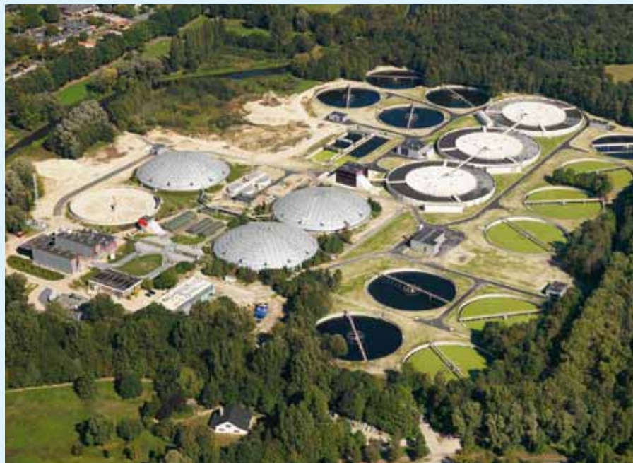
De rioolwaterzuiveringsinstallatie van Eindhoven.

Om de geschetste knelpunten te ondervangen, stonden binnen Waterschap De Dommel tal van projecten op stapel, variërend van het zoeken naar de meerwaarde van effluentpolishing, toepassing van Real Time Control gericht op minimaliseren van de emissie vanuit de overstorten tot verdere uitbreiding van de rwzi. Gezien de enorme omvang van de investeringen die aan de orde zouden zijn bij het uitvoeren van al deze plannen en