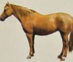
Mustang Land van herkomst: Verenigde Staten. Kleur: alle kleuren toegestaan.