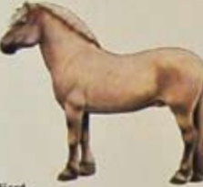
Fjord Land van herkomst: Noorwegen. Kleur: vaak isabel met een deels donkere maneniam en een zwarte aalstreep.