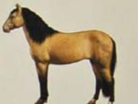
Spaanse mustang Land van herkomst: Verenigde Staten. Kleur: alle voorkomende kleuren.