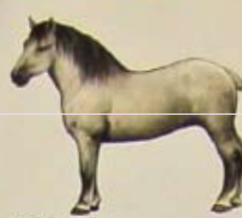
Bretons paard Land van herkomst: Frankrijk. Kleur: vos-wan, maar ook vos, bruin en schimmel zijn toegestaan.