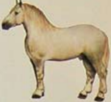
Percheron Land van herkomst: Frankrijk. Kleur: schimmel en zwart.