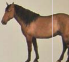
Zwavel mustang Land van herkomst: Verenigde Staten. Kleur: zwavel, grijs/zwart.