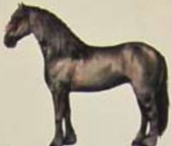
Fries Land van herkomst: Nederland. Kleur: gitzwart.