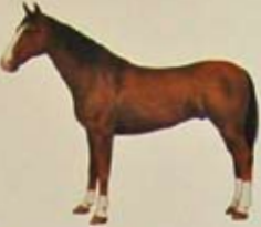
Gelders paard Land van herkomst: Nederland. Kleur: vos of schimmel, vaak witte aftekening.