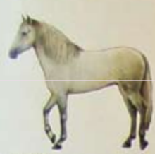
Andalusier Land van herkomst: Spanje. Kleur: schimmel. Ook komen zwart, bruin en vos voor.