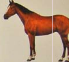
Holsteiner Land van herkomst: Duitsland. Kleur: van licht- tot zwartbruin, maar zwart schimmel komen ook voor.