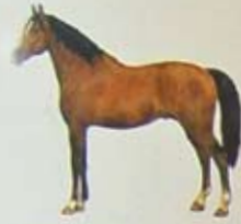
Normandische Cob Land van herkomst: Frankrijk. Kleur: vos of bruin.