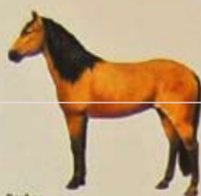
Berber Land van herkomst: Noord-Afrika. Kleur: donker- en lichtbruin, vos, zwart en schimmel.