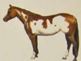
Spotted Saddle Horse Land van herkomst: Amerika (Tennessee). Kleur: bonte vacht.