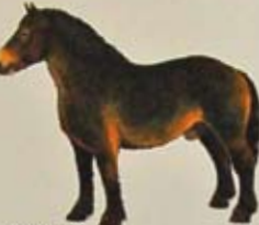
Zweeds paard Land van herkomst: Zweden. Kleur: (donker)bruin, vos of grijs. Alle effen kleuren zijn toegestaan.