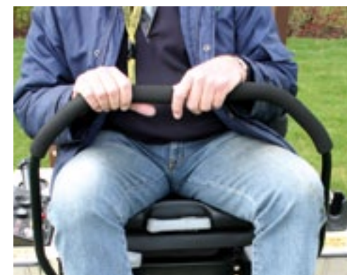
Je kunt relaxed rijden met de machine. Je moet amper kracht zetten om de hendels te bedienen.