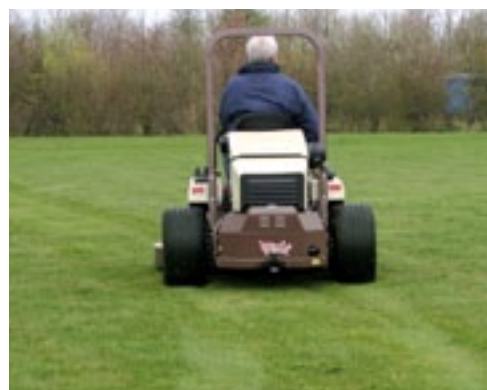
Door de montage van brede banden is er nauwelijks insporing.

en bladeren niet in de radiator gezogen worden. De motorkap ontgrendel je door twee bajonetsluitingen los te draaien. Vervolgens klapt je de kap naar boven. Alle punten voor het dagelijks onderhoud zijn goed bereikbaar. ■