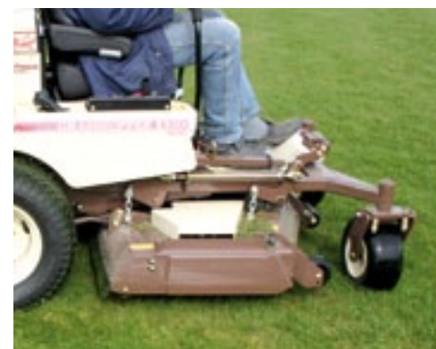
De machine draait helemaal rond haar as zodat de voorwielen bijna dwars komen te staan.