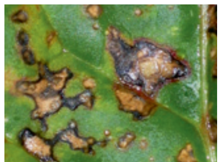
Foto 10 en 11. Gemakkelijk te verwarren: bladvlekken veroorzaakt door cercospora (links) en door pseudomonas (rechts).