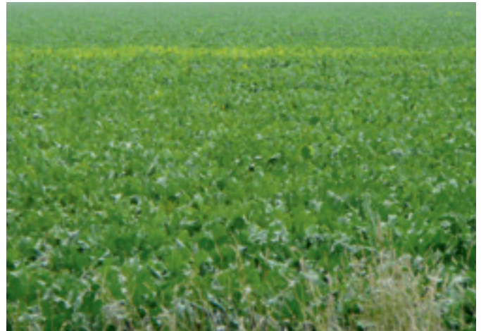
Foto 1 en 2. Links een plek met vergelingsziekte. Rechts een opvallende, scherp afgebakende plek met blinkers (rhizomanie).