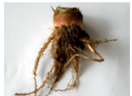
Foto 7, 8 en 9. Het wortelstelsel vertelt een heel verhaal. Links vertakkingen als gevolg van een slechte bodemstructuur. In het midden het afsterven van de zijwortels door een te lage pH. Rechts vertakkingen en vorming van haarwortels door aantasting van het gele bietencysteaaltje.