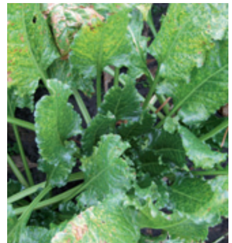
Foto 6. De symptomen van gele vlekjes. Hiertegen is helaas nog geen sluitende oplossing aanwezig.

Uit het bovenstaande blijkt dat er veel zaken op een perceel kunnen spelen, zie voor een overzicht van enkele hulpmiddelen het kader 'Hulp bij diagnose' op pagina 12.