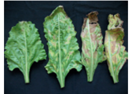
Foto 3, 4 en 5. Gele symptomen die gemakkelijk zijn te verwarren. Links een blad met magnesiumgebrek. Dit uit zich in geelverkleuring tussen de nerven, beginnend aan de top van het blad. Later kan er op de top van het blad een zwarte rand ontstaan. Midden, mangaangebrek: wolkerige gele vlekken tussen de nerven in het blad. Rechts, verticillium: geelverkleuring tussen de nerven met in een later stadium afsterving (verbruining) van de vergeelde stukken blad. Symptomen treden vaak eerst op de helft van het blad op.

bodemstructuur kunnen de mate van aantasting van diverse ziekten en plagen veel erger maken. Het wortelstelsel van de biet geeft al vaak een signaal van de oorzaak af. Spit de biet hiervoor uit met een schepje of schop en klop voorzichtig de grond van de wortels en bekijk ze goed, eventueel met een loep (foto's 7 t/m 9). Zit er nog te veel grond aan, spoel de wortels dan voorzichtig onder de kraan af en leg ze in een bakje water.