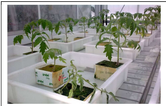
Figuur 1: Verwelking als gevolg van Clavibacter michiganensis subsp. michiganensis .

Cmm is moeilijk te detecteren in zaden. Mogelijk kunnen in aanvulling op de zaadtoetsen, (jonge) planten worden bemonsterd. Hiervoor is het belangrijk om meer informatie te genereren over de verspreiding van de bacteriën in plantmateriaal. Deze ontwikkelde kennis is ook van belang bij een uitbraak om geïnfecteerde partijen op te sporen.