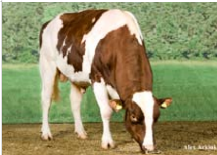
VAN DE PEUL KYLIAN (KIAN X LIGHTNING)