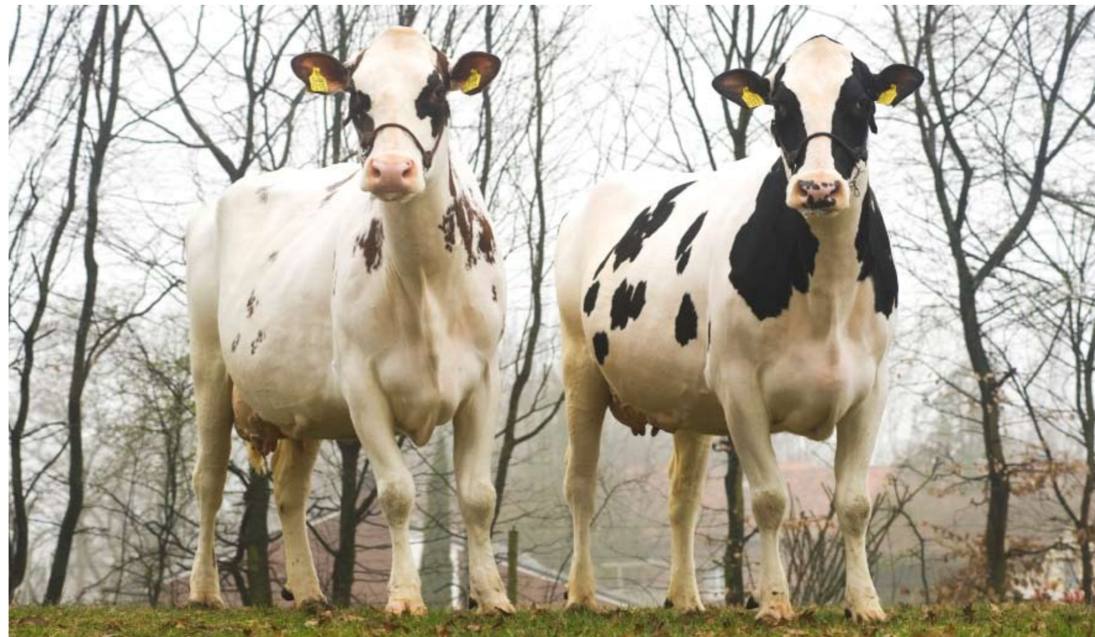
Kylians volle zuster Massia 9215 (v. Kian) samen met Goldwyndochter Massia 9397

Met zijn productiecijfers en goede duurzaamheidsscores past Kylian volgens Huntjens goed in de huidige fokkerijfilosofie. 'Bedrijven worden alsnog groter en willen minder trammelant met de koeien. Kylian past goed in dat geval.'