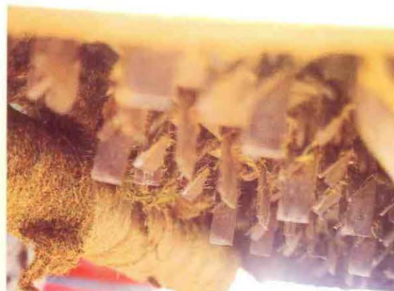
"de mesjes op de as"

Coops: "In principe staan de Zetor en de Amazone het hele jaar aan elkaar gekoppeld. Alleen in de winter wil het wel eens gebeuren dat er een kar achter de Zetor gezet wordt om stammen en hout mee te transporteren. "In de toekomst willen de mannen van Gendersteyn de Zetor nog uitvoeren met een fairwayslitter. Want dat is een machine die nog op het verlanglijstje staat.