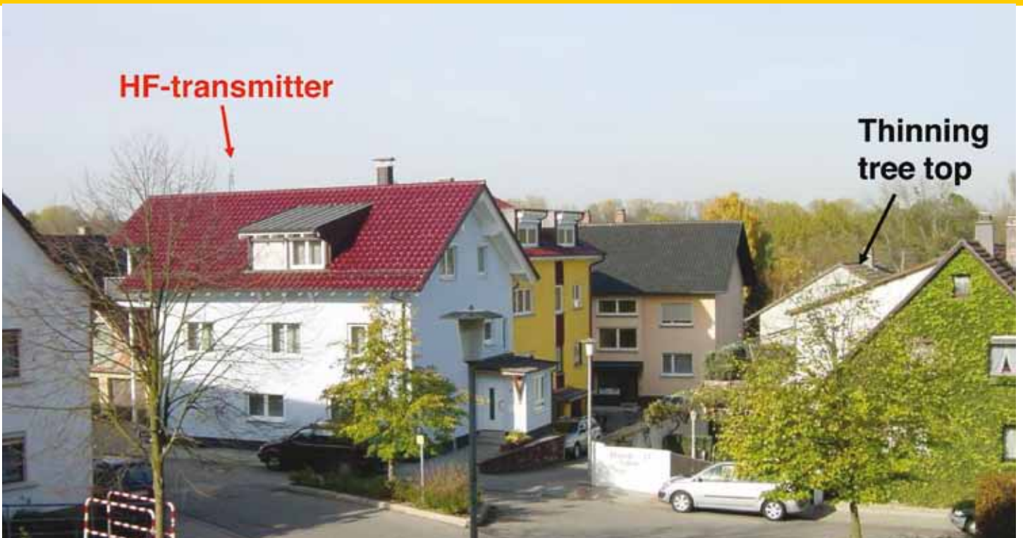
Een foto uit de presentatie van Volker Schorpp. De linde links staat in de straling van de zendmast (HF-transmitter) en is al vroeg in het seizoen zijn blad kwijt. De linde rechts wordt gedeeltelijk beschermd door het witte huis met het rode dak: alleen de kop wordt door straling bereikt, waardoor de kop dun in blad zit. De kleine linde in het midden, met waarschijnlijk minder doorwortelbaar volume, staat in de stralings schaduw van het huis en zit nog volledig in blad.

tingen het meest heftig. Dat betekent ook dat in de hoofdstraal niet per saldo de meeste schade ontstaat. Gebouwen, bomen en andere obstakels in de buurt, kunnen andere bomen beschermen: ze staan als het ware in de stralingsschaduw. Hij liet plaatjes zien die zijn verhaal staafden.