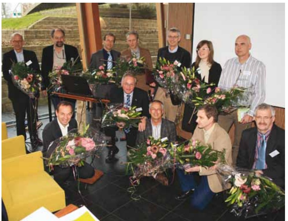
Spreekers en organisatoren van het symposium "Het effect van elektromagnetische straling op bomen" werden in de bloemen gezet.

En of straling nu ook voor mens en dier schadelijk is? Dat is een andere discussie die u zelf mag invullen.