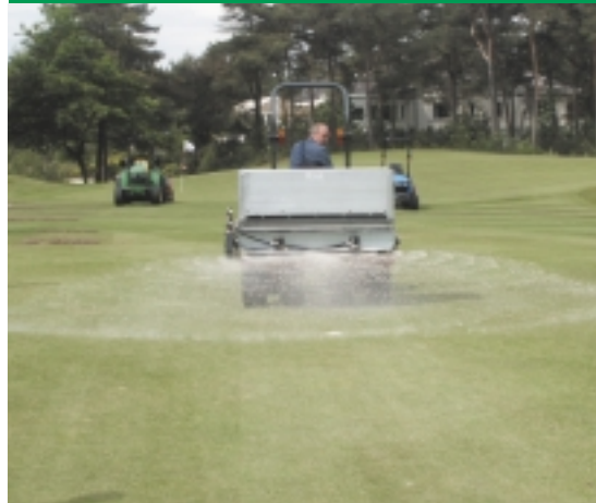
▼ De Rink 1010 tijdens de laatste Barenbrug op de Nunspeetse