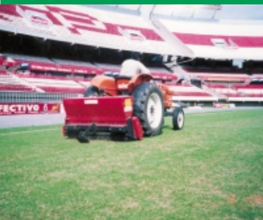
▲ Het River Plate stadion in Buenos Aires, waar Nederland in 1978 de WK finale verloor, gebruikte de Verti-Seed om door te zaaien.