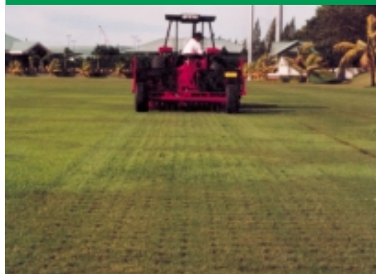
▲ De Verti-Drain is vitaal voor het drooghouden van de polovelden van de sultan van Brunei.