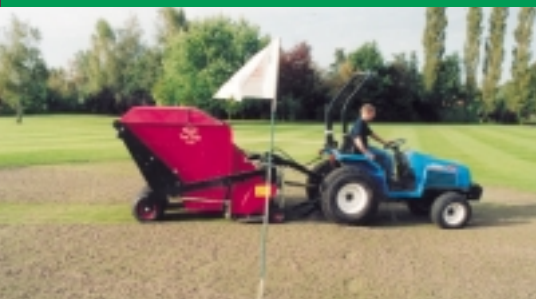
▲ De nieuwe turf-Tidy is ideaal voor het opvegen van proppen van de green.