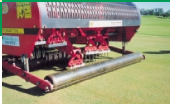
▲ Verti-drainen met ø 5 mm haarpennetjes kan vlak voor een golftoernooi gedaan worden.