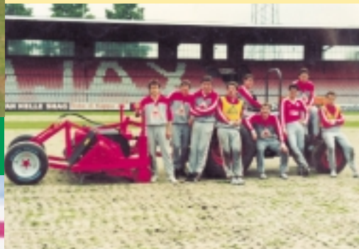
▲ De " Gouden " Ajax generatie van de 80-er jaren speelde veelvuldig op een geverti-drainde ondergrond in stadion de Meer.

werden door een Verti-Drain in topconditie gebracht en gehouden. Zo werden de Kuip en Yokohama de dag voor de finales nog geverti-draind, waardoor het veld in topconditie was. Daarnaast wordt de Verti-Drain in vele andere omgevingen gebruikt, zoals tennisbanen (Wimbledon Tennis Courts), begraafplaatsen (Common Wealth War Graves Commission), tuinen (Japanse Keizerlijke Tuinen), pretparken (Disney Land) etc.. Kortom de Verti-Drain is een noodzakelijke onderhoudsmachine geworden voor alle soorten grasvelden.