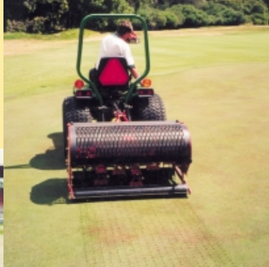
▲ Australië's nr.1 golfbaan, Royal Melbourne GC, verti-draint z'n greens eens per week met naaldpennen.

Al deze machines vinden hun weg via het wereldwijde distributienetwerk naar de vele golfcourses, gemeentes, voetbalclubs en loonwerkers. In de U.S.A., UK en Australië heeft Redexim eigen vestigingen. De gehele operatie wordt geleid vanuit Zeist, Holland. Productontwikkeling, inkoop, logistiek en marketing worden vanuit Zeist aangestuurd, waardoor wereldwijd Redexim-Charterhouse machines een gedegen reputatie hebben opgebouwd. Binnen Nederland worden de Redexim-Charterhouse producten verkocht in Noord en Zuid Holland door firma Perfors en door de Gebr. Bonenkamp voor de rest van Nederland.