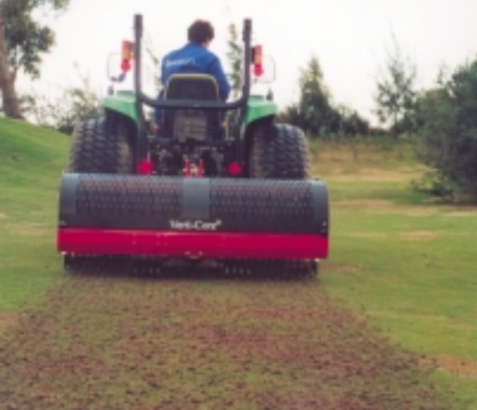
▲ Alicante GC's (Spanje) nieuwe Verti-Core holprikker