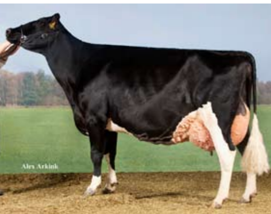
Wilhelmina 401 (v. James), kampioene oudere koeien Prod.: 5.05 297 15.054 3,80 3,54 lw 141