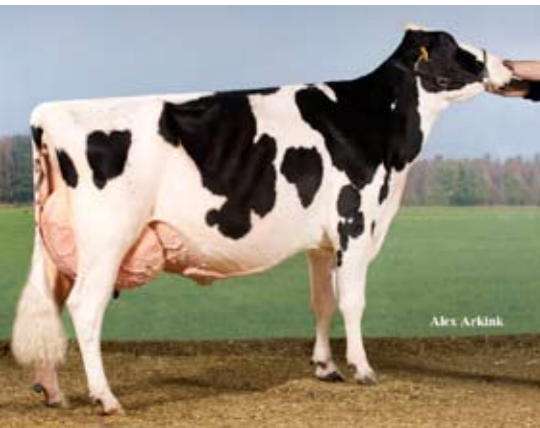
Bons-Holsteins Aaltje 69 (v. Gibson), algemeen kampioene Prod.: 4.04 119 4910 5,58 3,32 lw 112 l.l.