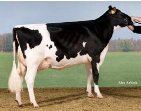
Wekken-Holstein Guurtje 280 (v. Goldwyn), kampioene vaarzen Prod.: 2.00 97 3021 3,96 3,48 lw 108 l.l.