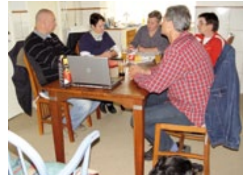
Nubische fokgroep vergadering bij de familie De Haas thuis.