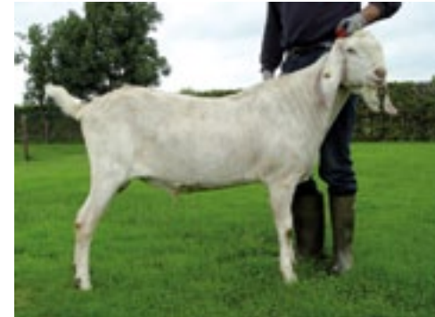
Een van Karins fokbokken: White Perry van de IJsselstee.