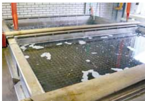
Figuur 3. Uien behandelen in een warmwaterbad

Warmwaterbehandeling (figuur 3) kan valse meeldauw besmetting van bollen onderdrukken (figuur 4), mits het goed wordt uitgevoerd.