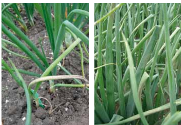
Figuur 1: Systemisch aangetaste plantuien