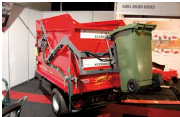
Nimos toonde een AIS (afvalinzamelsysteem) voor kliko's op een UK 1,5-DS kipper. In deze 130 cm smalle kipper kan 2 kuub afval. De bediening is hydraulisch. Hij kost 16.000 euro. AIS kan ook op andere kippers.