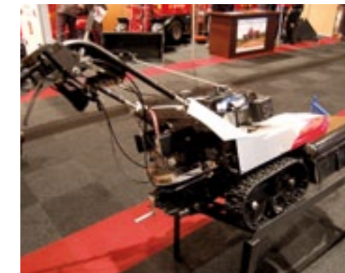
Een trial, zo noemt Vormec de Iseki SC245 Pro. Met dit prototype peilt de importeur de interesse van de bezoekers. Deze maaier staat op rupsen voor moeilijke terreinen. Voordeel is dat hij hierdoor smal blijft. Hij heeft een 4,5 pk Honda, de hydrostatische rijaandrijving haalt 44 km/h. Het aluminium maaidek is 60 cm breed. De maaihogte is traploos van 2 tot 12 cm in te stellen. De rupsmaaier weegt 130 kg en kost 3.845 euro.