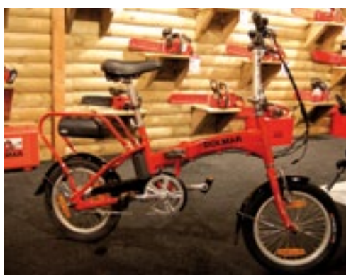
Met een elektrische vouwfiets trok Dolmar aandacht voor zijn accumachines. Deze fiets heeft twee 18 volt lithium-ionaccu's die ook in de tuinmachines zitten en kost 500 euro.