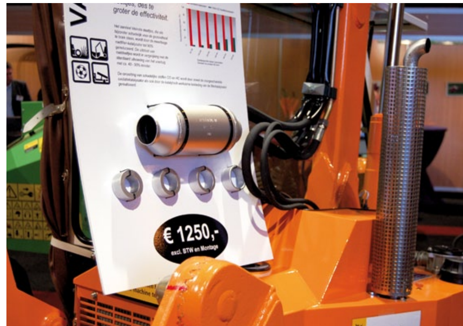
Wil je duurzaam inkopen? Vanderklugt Groentechniek levert een universele roetfilterkatalysator van Boki voor 1.250 euro. Dit compact model past op elk voertuig. Er zijn diverse ringen voor de verschillende uitlaten. Het Twin-Tec roetfilter bestaat uit twee lagen, zoals een metaaldragerkatalysator. Het vezelvlies vangt de roetdeeltjes. Hij werkt vanaf 200 tot 280 graden Celsius en reduceert de kleine deeltjes met 90 procent. De uitstoot van roetdeeltjes daalt met 40-50 procent.