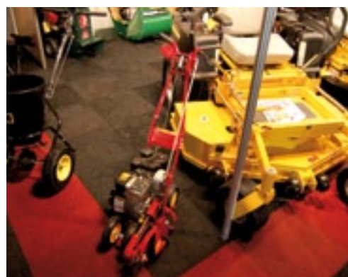
Nieuw bij Lankhaar is de McClane kantensnijder. Deze Amerikaanse machine kost met 3,5 pk B&S 595 euro, met professionele 4 pk Honda is dit 995 euro. De hoek verstelbaar gaat eenvoudig. De snijkop met spatlap is afgeschermd en er zitten vetnippels op de lagers. Ook heeft Lankhaar de import gekregen van Bell houtklovers.