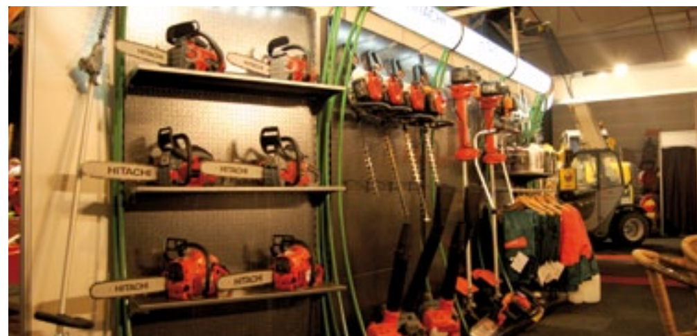
Hitachi breidt zijn assortiment uit. Nieuw is een 40 cc kettingzaag en een hele lijn handgereedschappen, zoals een snoeischaar, telescoopsteel, olie, maaidraad, kettingen, maar ook kleding. Ook toonde Hitachi een eigen lijn gazonmaaiers van 42 en 47 cm; die komen overigens van het Italiaanse Ibea.