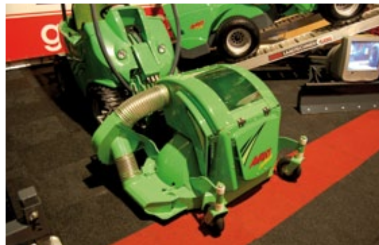
Gems showde een 120 cm maaidek met opvang via afzuiging aan een Avant minilader. Het prototype wordt nog aangepast. De bak gaat nu nog met de hand open, en een sensor die aangeeft dat hij vol zit ontbreekt.