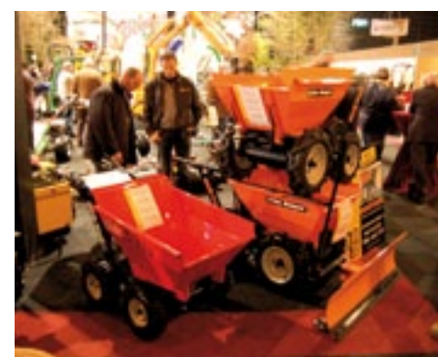
Van de Muck-Truck motorkruiwagen is er nu ook een kleiner, eenvoudig model: de Bizzy. Hierin kan 200 kg. Handig is dat je hem handmatig kunt verrijden zonder dat de motor loopt. Met 6,5 pk B&S is de prijs 1.695 euro. Je moet dan wel choken, en hiervoor moet je de bak omhoog doen.