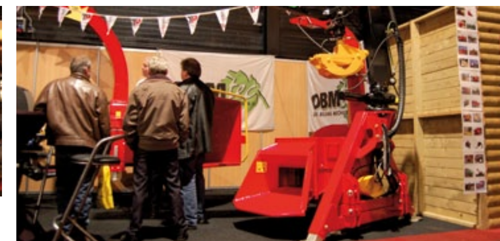
Nieuw bij OBMtec is de TP 230K kraaningevoerde versnipperaar. Deze zijlader kan hout tot 23 cm verwerken en weegt met kraan 1.740 kg. De Mowi kraan reikt tot 4,7 meter. De houtinvoer is scheef op de hakschijf. Hij is er voor in de driepunt van een trekker van minstens 70 pk. Prijs: 42.500 euro.