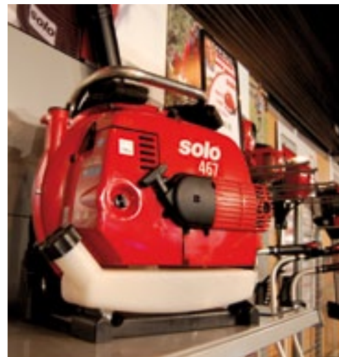
Vledder toonde de nieuwe Solo 467 rugbladblazer. Die heeft een schone en stille 66 cc Solo 'Blue 2' tweetaktmotor met katalysator. Hij blaast 1.400 kuub lucht per uur en kost 503 euro. Ook voert Vledder naast Sabo Solo en Murray gazonmaaiers, waardoor het aanbod nu uit zestig modellen bestaat.