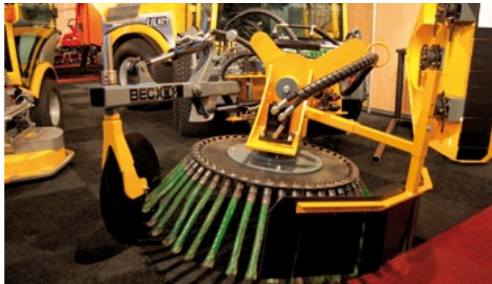
Frans Bex lanceerde een onkruidborstel met kantensnijder. Het werktuig heeft een universele aanbouw. De kantensnijder kan 20 cm links/rechts uitwijken door accumulators. Richtprijs: 12.500 euro.