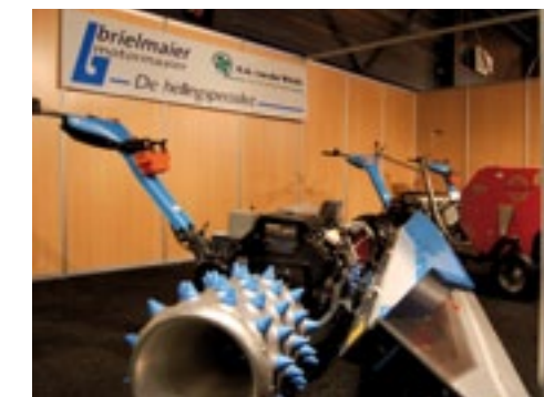
Brielmaier eenassers kon je op de stand van Van der Waal uit Ridderkerk zien. Die heeft de import van Bexx Tuinmachines overgenomen. Fabrikant Brielmaier wil namelijk de dealers rechtstreeks beleveren. Dit past niet in de visie van Bexx. Ook heeft Bexx al veel merken in zijn pakket. Van der Waal toonde de nieuwe Hill-Rake bandhooier en een 27 pk model met een Caeb balenpersje. Die maakt ronde balen van 50x50 cm en 25 kg.