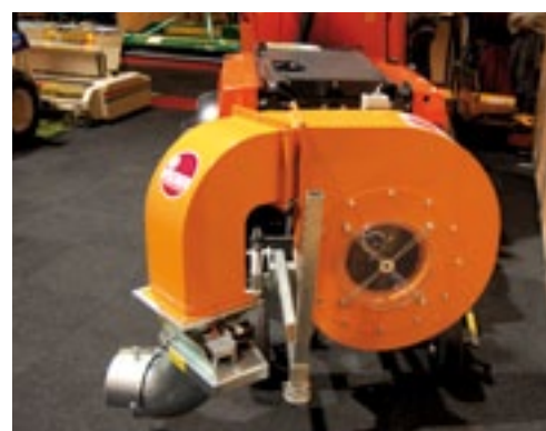
Nieuw bij Vormec zijn de Fischer bladblazers en -zuigers. Er is een hele range leverbaar. Deze Duitse fabrikant was voorheen Duits importeur van Votex machines.