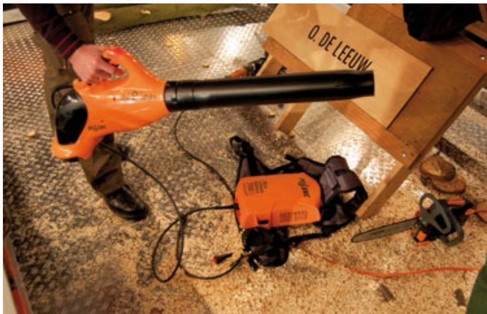
O. de Leeuw timmert goed aan de weg met Pellenc accugereedschap. Nu is er weer een nieuw gereedschap, de AiRion accublazer. Het prototype met plastic kap heeft veel blaaskracht. Levertijd: eind 2011.