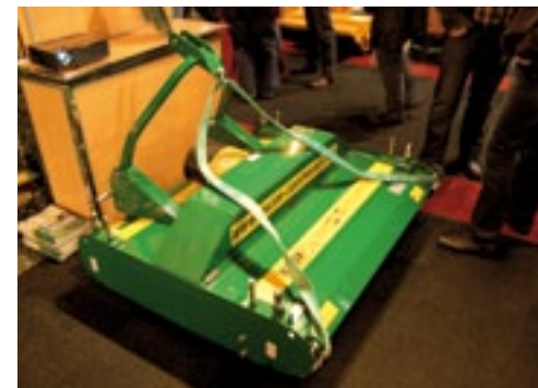
Van Major is er nu ook een 135 cm smalle Rollermower. De 4200 is voor in de driepunt van kleine trekkers van 15-25 kW (20-34 pk) en handig voor bijvoorbeeld campings. Er zit voor- en achterop een brede rol. Achter de voorste rol zit een klep waardoor er een luchtstroom ontstaat die het gras omhoogzuigt voor het slagmes. Mede hierdoor ontstaat een maaikwaliteit à la kooimaaiër, weet Major. Hij weegt 350 kg en kost 5.000 euro.