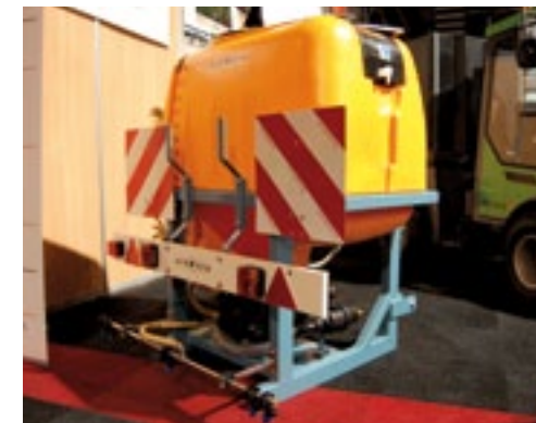
Naast de MCP heetwaterunit (zie pagina 28) toonde Empas ook een pekelspuit voor in de driepunt. Er zit een speciale pomp op die tegen pekewater kan. Verder zijn alle leidingen van roestvaststaal. Standaard is de boom 150 cm breed, optie is 50 cm extra. De spuitboom komt niet buiten het frame. Standaard is een verlichtingsbalk. Met 600 liter tank en 2 meter boom is 10 km te spuiten. Een rijnsnelheid van 15 km/h is mogelijk. De prijs is vanaf 2.500 euro met 200 liter tank.