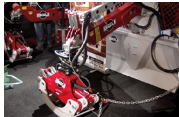
Bod uit Beek presenteerde machines van het Duitse BGU. BGU maakt een hele range machines voor de houtverwerking. Van kloofmachines, zaagtafels, bosbouwladers, -kranen en houtklemmen tot versnipperaars.