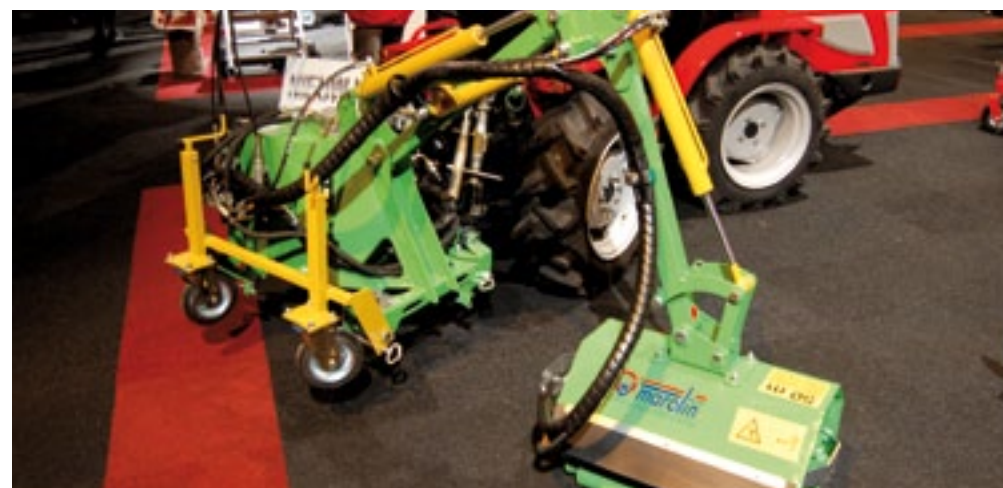
Voor 15-20 pk trekkers vanaf 700 kg showde Hissink de Marolin Micro hydraulische arm. Een eigen hydropomp die je op de aftakas zet drijft de arm aan. Hij reikt 200 cm horizontaal en kan heggen tussen 65 en 130 cm hoog snoeien. De klepelbak is 60 cm breed. Hij weegt 275 kg en kost 5.830 euro.