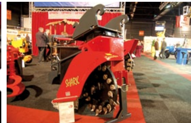
Ufkes Greentec toonde de Shark stubbenfrees voor kranen met 150-265 liter olie en 420 bar. Kenmerken: beitels met dubbel widia, 87 cm groot freeswiel met zijbeitels. Hydraulische draaikop is optie. Prijs: 15.649 euro.