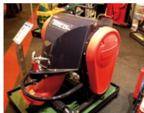
De Trilo BL400 blazer van Vanmac is 35 kg lichter geworden door kunststof zijkappen en uitlaatmond. Handig voor kleine voertuigen. Hij weegt nu 245 kg en kost 6.800 euro.