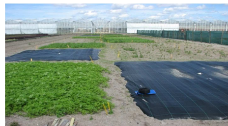
Aanleg diverse maatregelen tegen Pp op duinzandgrond

Selectie van perspectievolle maatregelen tegen Pp het worteltesieaaltje en de bodemschimmel Verticillium uit het PPO-AGV project Bodemgezondheid op dekzandgronden: Biologische grondontsmetting (BGO) - Chemische grondontsmetting (CGO) - Tagetes (Afrikaantjes) - Japanse haver.