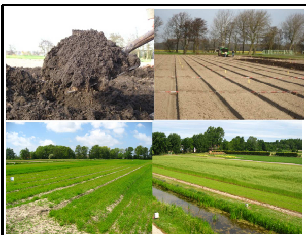
Aanleg O.S. proef en groei gewas japanse haver zomer 2010

Uit eerder onderzoek is gebleken dat een verhoging van het O.S. niveau van duinzandgrond leidt tot een verbeterde bodemweerbaarheid tegen het wortelknobbelaaltje ( Meloidogyne hapla ), het worteltesieaaltje ( Pratylenchus penetrans ) en Pythium wortelrot.