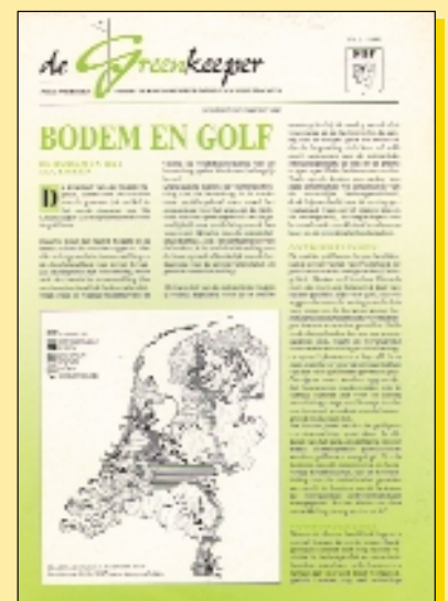
Een aantal exemplaren van het vakblad Greenkeeper, zoals dat door Brewer en Collinge gemaakt werd.