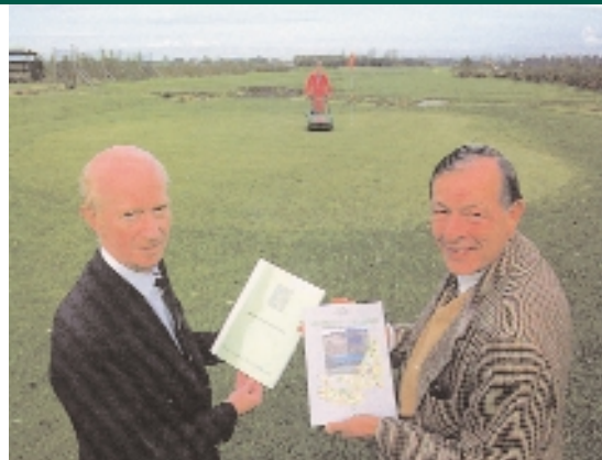
Een foto uit de oude doos Brewer en Collinge bij de presentatie van het beheersplan golfbanen halverwege de negentiger jaren.

Brewer: "In dit stuk kun je onder andere lezen dat het grootste gevaar voor een club komt van een bestuur van single handicappers. Die begrijpen niet dat je een baan moet bouwen en onderhouden voor bogey spelers."