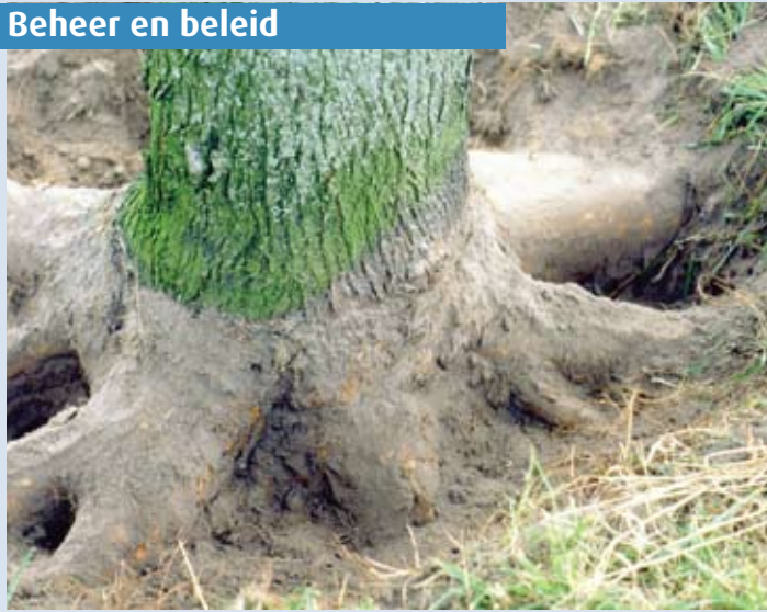
foto 1a Een voorbeeld van een stabiele iep ('Dodoens', veredeld op Ulmus montana ) met een goed ontwikkeld wortelstelsel.