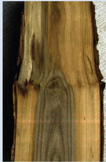
<< foto 4 a & b Overmatige schotvorming op de linker afbeelding (hier bij de cv Hoersholmiensis van de veldiep) kan wijzen op uitgestelde onverenigbaarheid. De afbeelding rechts is een stamdoorsnede van een iep uit dezelfde beplanting.