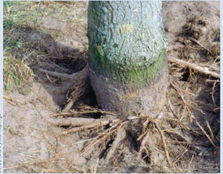
foto 1b Hier een even oude 'Dodoens' (ca. 18 jaar) in dezelfde beplanting en groeiomstandigheden (Doorlopende dijk, Holten) met een sterk achtergebleven wortelontwikkeling.