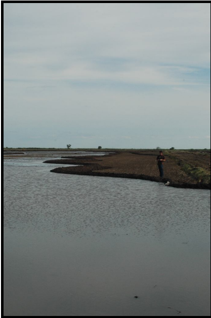
Imagen 1 – Diques de contorno construidos por medio de maquinaria sofisticada operada con láser.