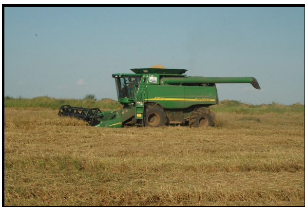
Imagen 2 – MIA está cosechando el campo de un “productor asociado” con cosechadora

Un interés de 14% se cobra por año por los créditos tomados y aplicados para el periodo entre el día de entrega del servicio y el día de entrega en la fábrica. 7