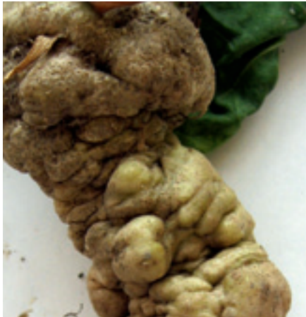
Foto 1. Late aantasting door de schimmel aphanomyces.

Bij de bietenkliniek zijn dit jaar ruim 230 bietenmonsters onderzocht. Daarbij ging het onder andere om plantwegval, slechte groei, bladvlekken en wortelrot. Net als in voorgaande jaren zaten er ook dit jaar opmerkelijke ziekten en plagen tussen. Hieronder volgt een overzicht van de meest bijzondere.