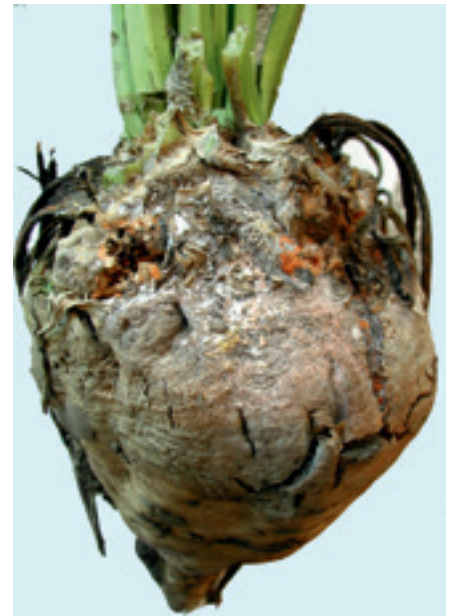
Foto 4. Koprot veroorzaakt door het stengelaaltje. Op foto 5 is te zien hoe dit er aan de binnenkant uitziet.

Ook in het najaar kwamen enkele bietenmonsters binnen met koprot, veroorzaakt door het stengelaaltje (foto 4). Bij een lichte aantasting is dit moeilijk te zien. Bovenaan de kop ontstaat verkurkt weefsel met verticale scheurtjes. Snijdt men een dun plakje van de biet af, dan zijn bruine vlekjes in de biet te zien (foto 5). Bestrijden van het stengelaaltje is moeilijk. Schade in bieten is te beperken door