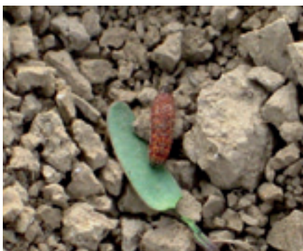
Foto 2. Rupsenvraat aan kiemplanten door de rups van de bruine herfstuil.

Normaal gesproken zien we rupsenvraat alleen in de zomer. Dit jaar kwam er al vroeg in het groeiseizoen een melding van schade door rupsen aan kiemplanten (foto