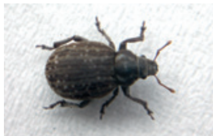
Foto 3. De grijze bolsnuitkever (5-8 mm groot) vreet aan de bladeren van jonge bietenplanten.

De grijze bolsnuitkever (foto 3) vreet planten al aan in het jonge plantstadium. Deze snuitkever lijkt veel op de taxuskever, maar is kleiner (5-8 mm groot). Hij vreet voornamelijk aan de bladeren.