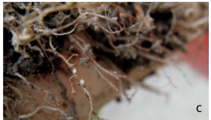
Foto 2. Beeld van symptomen van witte bietencystealtjes: A. valplek, B. veel zijwortels aan de biet en C. cysten op de zijwortels. Bij meer dan 150 eieren en larven per 100 ml grond is een witte bietencystealtjesresistent ras aan te bevelen.

kan het cijfer voor financiële opbrengst bij sterk afwijkende kwaliteit iets verschillen. Om voor iedere uitgangssituatie de financiële prestatie van de rassen te kunnen vergelijken, kan men gebruik maken van de Betakwik-module 'Rassenkeuze en optimaal areaal' ( www.irs.nl ). Tenslotte zijn er kenmerken die voor sommige telers interessant kunnen zijn. Een hoog cijfer voor de vroegheid grondbedekking kan gunstig zijn bij de onkruidonderdrukking. Het effect moet men echter niet overschatten. De kophoogte kan van belang zijn in verband met de rooibaarheid. Een H betekent dat de biet vrij hoog boven de grond staat en een L dat de biet vrij diep in de grond zit.