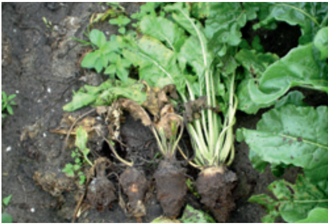
Foto 1. Rot als gevolg van aantasting door rhizoctonia. Bij meer dan 10% rotte bieten wordt de partij bieten geweigerd. Dit risico is te verkleinen door een rhizoctoniaresistent ras te zaaien.

Dit kan zich in gunstige seizoenen met voldoende hoge temperatuur enkele (drie tot vier) keren herhalen. Bietenplanten ondervinden hiervan schade, vooral doordat de opname van voeding en water door de wortel is verstoord (foto 2). In droge jaren is de schade het grootst.