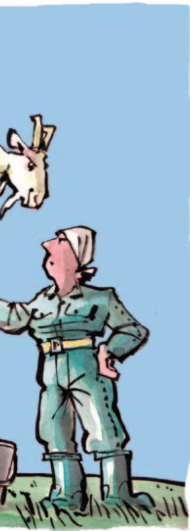
ILLUSTRATIE: HENK VAN RUTENBEK

Het is wel duidelijk dat je als boer niet om welzijnseisen voor je dieren heen kunt. Belangrijk is dat zowel boeren als consumenten zich – nu en in de toekomst – kunnen vinden in de manier van agrarisch ondernemen in Nederland. Welzijnseisen zijn daarbij onmisbaar. ←