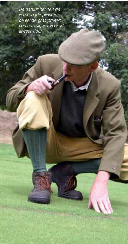
De natuur herstelt de verdroogde plekken; de eerste grassprietten komen volgens Verveld alweer door.

hier cultuurtechnisch de baan flink op de kop gezet. Onder dit deel van de baan loopt storende leemlaag. De zwarte grond van het terrein hier is door De Enk aan de kant gezet. Het leem eronder hebben ze gebruikt om nieuwe heuvellichamen te vormen. Vervolgens zijn de heuvels afgedekt met de zwarte grond en verschaald met zand uit de nieuw gegraven vijver. Het is een verbetering, maar ideaal is het nog niet. Bij een natte winter ben je met leem aan de beurt. Deze winter nog hebben we daarom een nieuw looppad achter de green van hole 8 gecreëerd. Daarvoor konden we de houtsnippers gebruiken die we in overvloed hadden vanwege de sneeuwschade in november 2005. Regelmatig snoeien van bomen en struiken op het terrein vind ik sowieso belangrijk. Voor gras is er wat dat betreft niets beroerder dan bomen. Wind moet er doorheen kunnen waaien, anders krijg je het Arena-effect.”