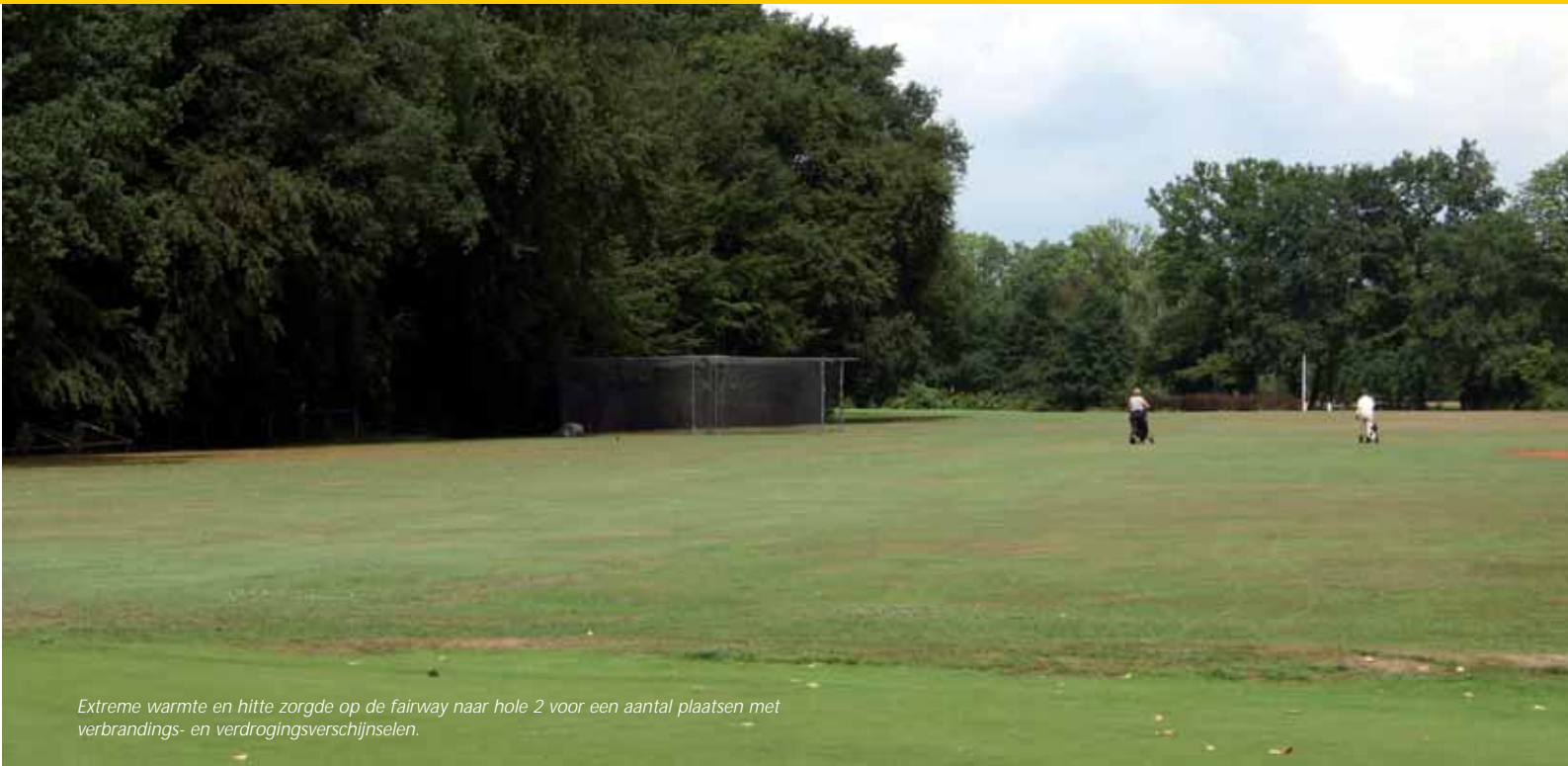
Extreme warmte en hitte zorgde op de fairway naar hole 2 voor een aantal plaatsen met verbrandings- en verdrogingsverschijnselen.