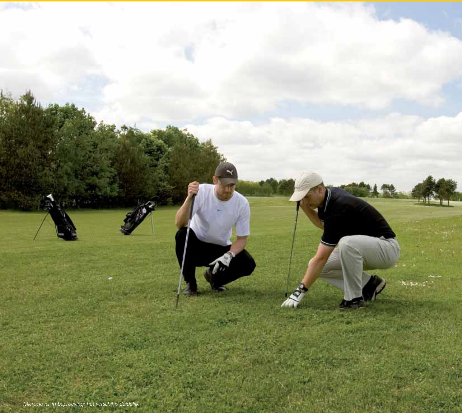
Microclover in beproeving: het verschil is duidelijk

baar voor het gras. Voor microclover in zie ik op de fairways enorme mogelijkheden. Vanwege de gewenste vlotte balrol, intensieve belasting en het gebruik van chemicaliën heeft klaver op greens en tees geen functie.