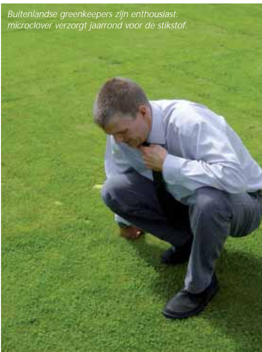
Buitenlandse greenkeepers zijn enthousiast: microclover verzorgt jaarrond voor de stikstof.