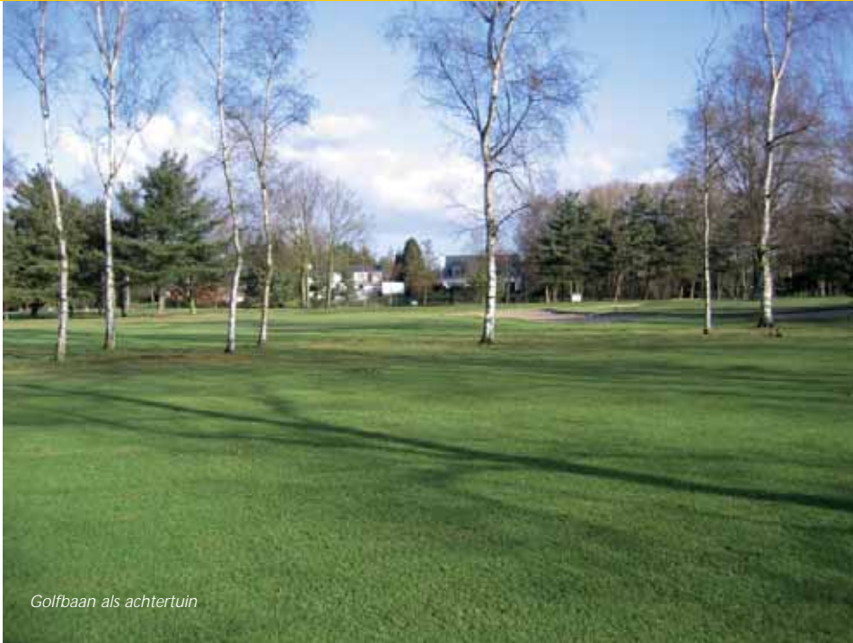
Golfbaan als achtertuin