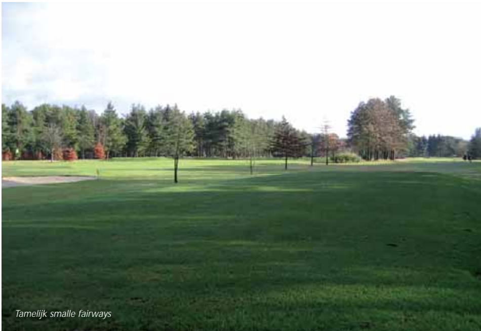
Tamelijk smalle fairways