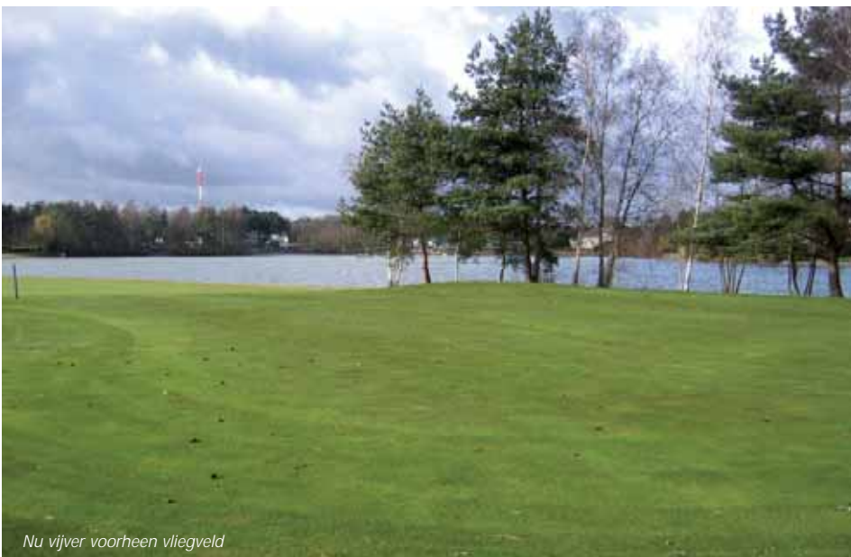
Nu vijver voorheen vliegveld