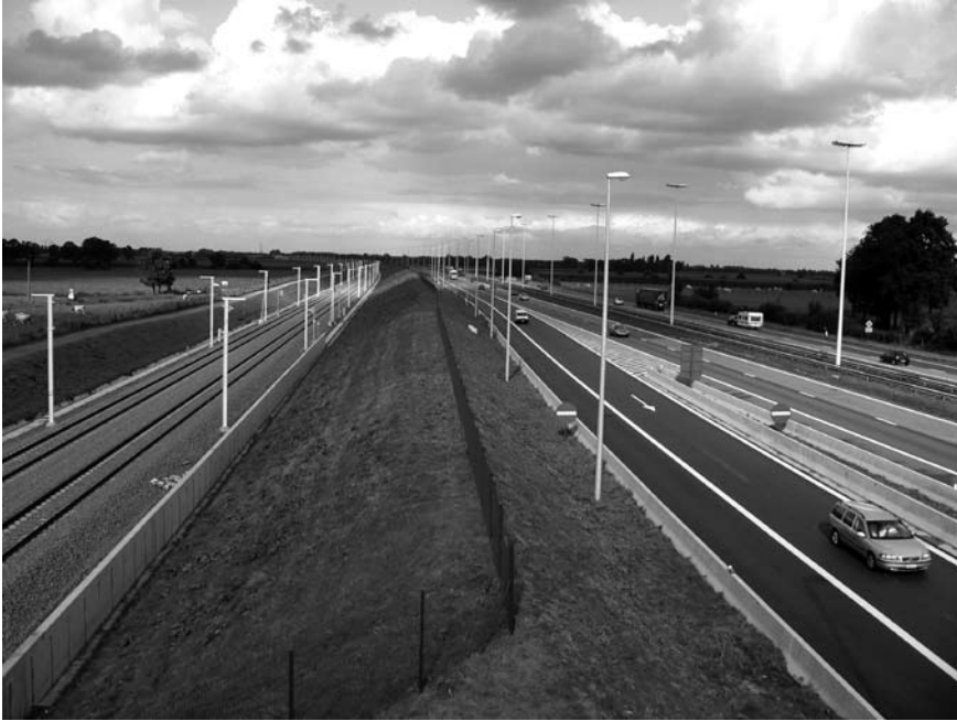
Imatge 3. Tren d'alta velocitat i autopista al sud d'Holanda.

Pel que fa a la política nacional de cinturons verds ( Rijksbufferzone-beleid ), segons l'Agència de Control Mediambiental els resultats han estat força positius. En aquest camp, el Govern central ha exercit des de la dècada de 1950 una gran influència en els plans de planificació regionals i locals, mitjançant la compra de terrenys per utilitzar-los com a espais verds i de lleure. En la major part dels casos, com a Midden Delftland, les administracions locals han compartit aquesta preocupació pels espais verds i han col·laborat activament en el manteniment i el control de les polítiques territorials. Tot i així, l'espai de lleure de la regió de Randstad encara és insuficient, i al voltant de les grans ciutats encara hi ha pocs llocs per anar amb bicicleta o caminar (Kuiper, 2008). Aquesta manca d'espais verds per a activitats de lleure és un dels problemes persistents de les polítiques holandeses.