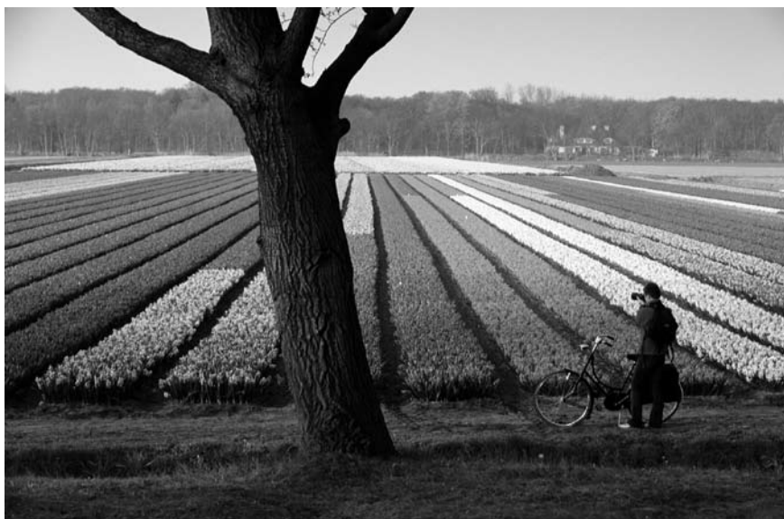
Imatge 1. El Memoràndum del paisatge es basa en el principi de la segregació funcional, característica associada internacionalment a la política ambiental i paisatgística dels Països Baixos.

específiques s'adreça als camps d'actuació següents: el patró paisatgístic natural, que recull una selecció dels patrons i els elements que determinen la identitat del paisatge holandès a escala nacional; les zones amb característiques històriques, culturals, geològiques i geomorfològiques de gran valor, anomenades paisatges culturals valuosos; les zones amb una obertura o un tancament visual singular, que es tradueix en la voluntat de conservació dels límits visuals a escala de paisatge; les zones on la qualitat del paisatge és tan minsa que cal plantejar-se una nova estructura del paisatge mitjançant plans de millora, i, per acabar, el paisatge periurbà que limita amb les grans ciutats situades al centre del país.