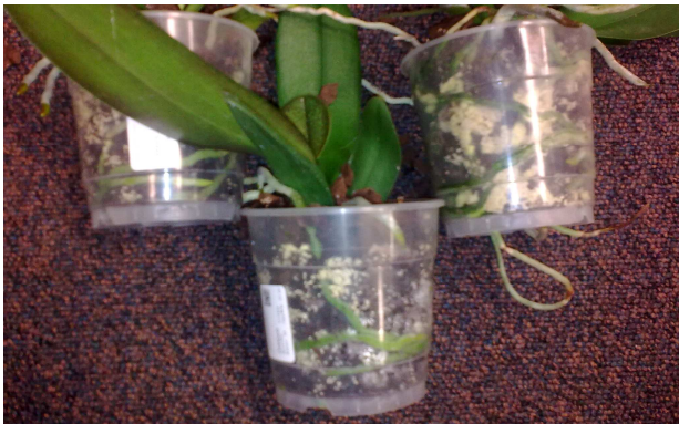
Figuur 1: overmatige schimmelgroei van Leucocoprinus birnbaumii .

Tijdens de teelt van Phalaenopsis komen worden steeds vaker vluchten waargenomen van paddenstoelen. Veelal gaat het om de goudgele plooiparasol Leucocoprinus birnbaumii . De schimmel vormt in de pot enorme hoeveelheden schimmelbolletjes. Naast een cosmetisch effect zorg de aanwezigheid van de schimmel voor een vocht afstotend medium.