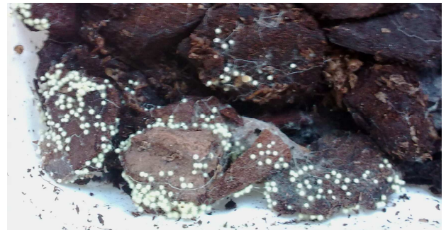
Figuur 3: overmatige schimmelgroei van Leucocoprinus birnbaumii op bark.

Ondanks het feit dat de schimmel goed groeit op een kunstmatig voedingsmedium. Kunnen we schimmel moeilijk explosief en gelijkmatig te laten groeien op bark. Daarom zijn middelen nog niet getoetst op substraat.