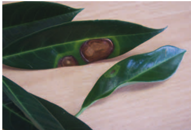
Otto Luyken met Xap

De symptomen van Xanthomonas arboricola pv pruni bestaan uit bladvlekken. De bacterie infecteert het blad via natuurlijke openingen en via beschadigingen. Aanvankelijk zijn de vlekjes klein, lichtgroen tot gelig groen en zichtbaar aan de onderzijde van het blad. Bij het uitgroeien en verder ontwikkelen van de infectie, worden de bladvlekken ook aan de bovenzijde van het blad goed zichtbaar als gelig groene vlekken waarvan het centrum afsterft en bruin verkleurd. Uit aantastingen in het verleden in het buitenland is gebleken dat ook takken en twijgen kunnen worden aangetast en reageren met de vorming van kankers. Hierin handhaaft zich de bacterie. Vanuit deze infecties kunnen nieuwe infecties ontstaan. De symptomen ontwikkelen zich in Nederland vooral in het najaar, maar kunnen (met name bij laurierkers) ook voorkomen in het eerste deel van de zomer. Inmiddels is Xanthomonas in meerdere monsters uit Prunus laurocerasus , aangetoond op diverse locaties in Nederland. De bacterie werd gevonden in de cultivars 'Otto Luyken', 'Rotundifolia', 'Novita', 'Etna'/'Anbri', 'Herbergii', 'Mischeana' en 'Caucasia'. De bacterie wordt voornamelijk aangetroffen bij gewassen in potten en containers, maar ook bij gewassen in de vollegrond. Van de bacterie is bekend dat deze met name in het najaar problemen geeft, en dat deze in het hout van gewassen kan overleven.