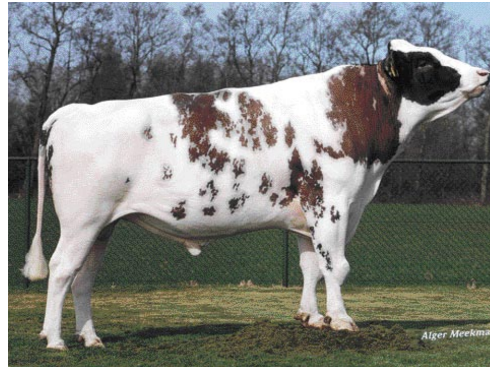
De afwijkende bloedvoering van Kian stremt de verkoop naar het buitenland