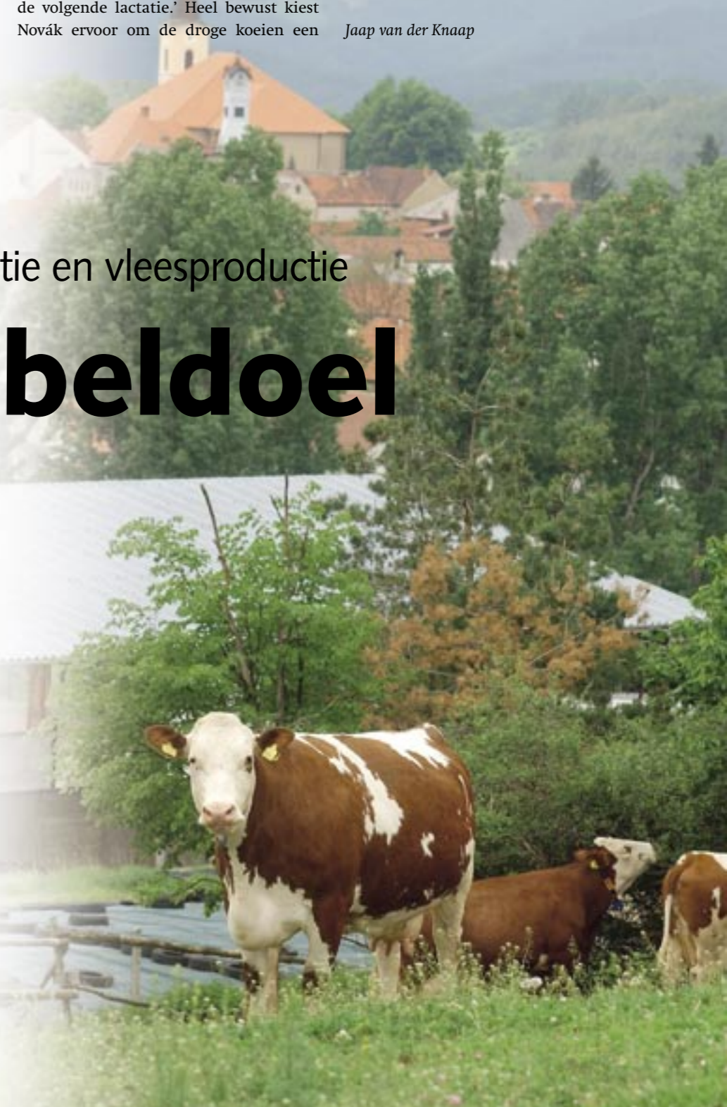
De droge koeien hebben bovenop de heuvel een speelweide