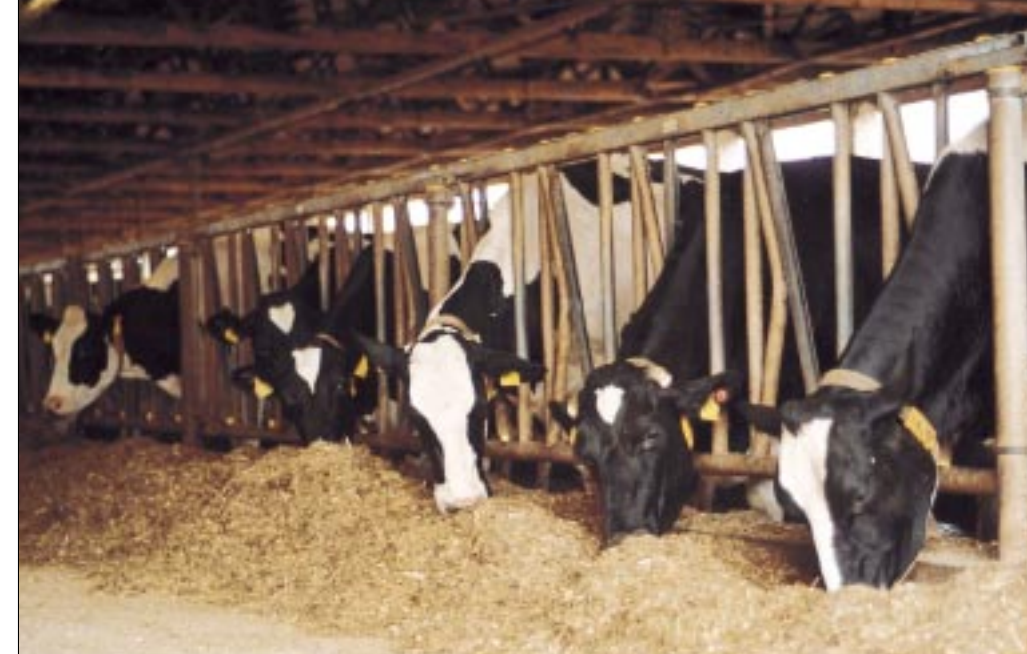
Koeien binnenhouden bespaart energie, kosten en arbeidstijd

Na verbetering van de ligboxenstal werd het melksysteem aangepakt. 'Iedereen hier in de buurt heeft een visgraatmelkstal, daarom heb ik voor een carrousel gekozen. Ik heb niet graag iets wat een ander al heeft', aldus Van Dolder. De achttienstandscarrouselmelkstal, waarin negentig koeien per uur gemolken kunnen worden, is in 2001 in gebruik genomen. De capaciteit van de melkstal is groter dan nodig bij het huidige aantal melkkoeien, maar bij de bouw is rekening gehouden met eventuele uitbreiding naar 300 melkkoeien. Door de carrousel tussen twee stallen in te plaatsen houdt de veehouder de mogelijkheid om eenvoudig vanuit de andere stal te kunnen melken. Van Dolder heeft de melkstal niet alleen gemoderniseerd voor uitbreiding van de veestapel. Hij wil ook de arbeidstijd efficiënter benutten. 'De oude bedrijfsleider is nog voor halve dagen bij me in dienst, maar ik wil er naar toe dat we het huidige werk met minder personeel rond kunnen zetten. Voordat ik in melkkoeien uit ga breiden moet ik eerst een vaster werkschema hebben, beter de dagen in plannen', vertelt Van Dolder. Zijn veertienjarige zoon