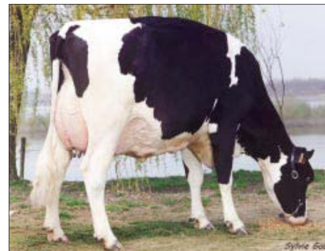
Rocktop Godena (v. Jolt), 91 punten Productie: 2,06 305 11.532 2,89 3,03 LW 127