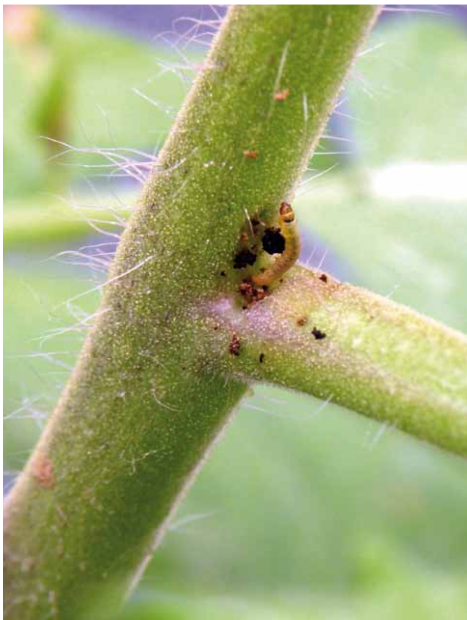
Een rups van Tuta absoluta doet zich tegoed aan een Spaanse tomatenplant.

Informatie: www.pherobank.com Contact: Frans.Griepink@wur.nl 0317 - 48 05 61