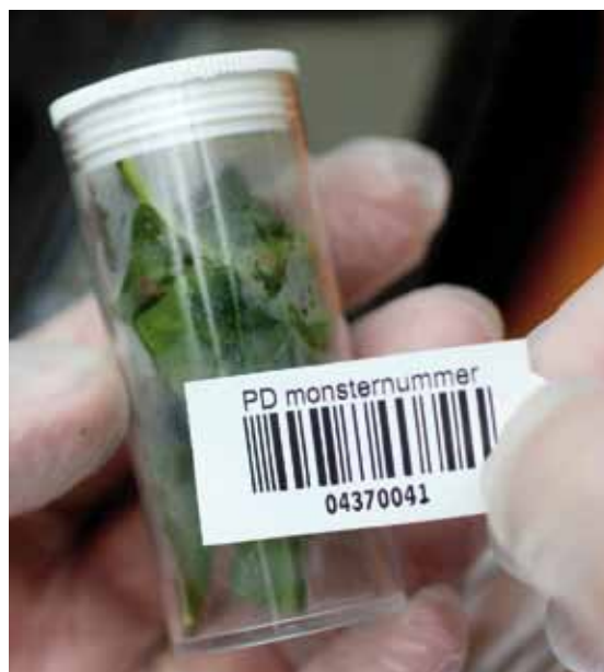
Controle door de plantenziektekundige dienst. LNV is bang dat controle aan de grens niet langer genoeg is en wil telers betrekken bij de bestrijding van plantenziektes.

Dit nummer gaat over die bestrijding: het fytosanitaire beleid. Nederland heeft veel belang bij een streng beleid, omdat het een grote producent en handelaar is in planten, van pootaardappelen en laanbomen tot bloembollen. Juist de handel maakt het leven van de plantenziektebestrijders lastig. De handelsstromen zijn zo groot dat het voor controleurs aan de grenzen ondoenlijk is