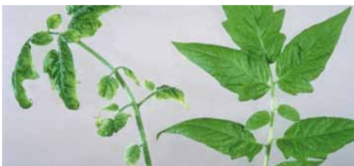
Links aantasting door het tomatengeelkrulbladvirus.