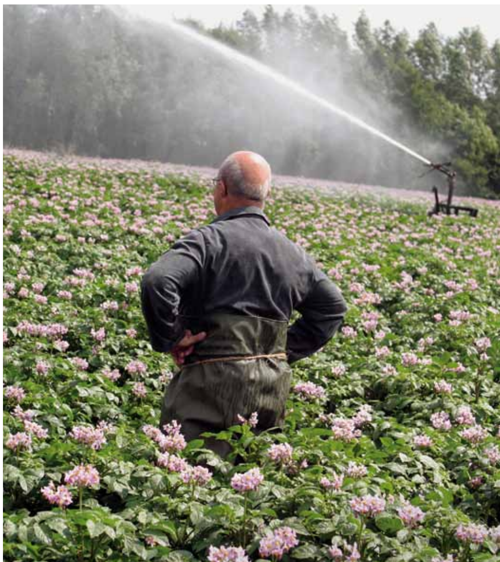
Akkerbouwer in zijn aardappelveld. De aardappelteelt wordt bedreigd door nieuwe varianten van het Y-virus.