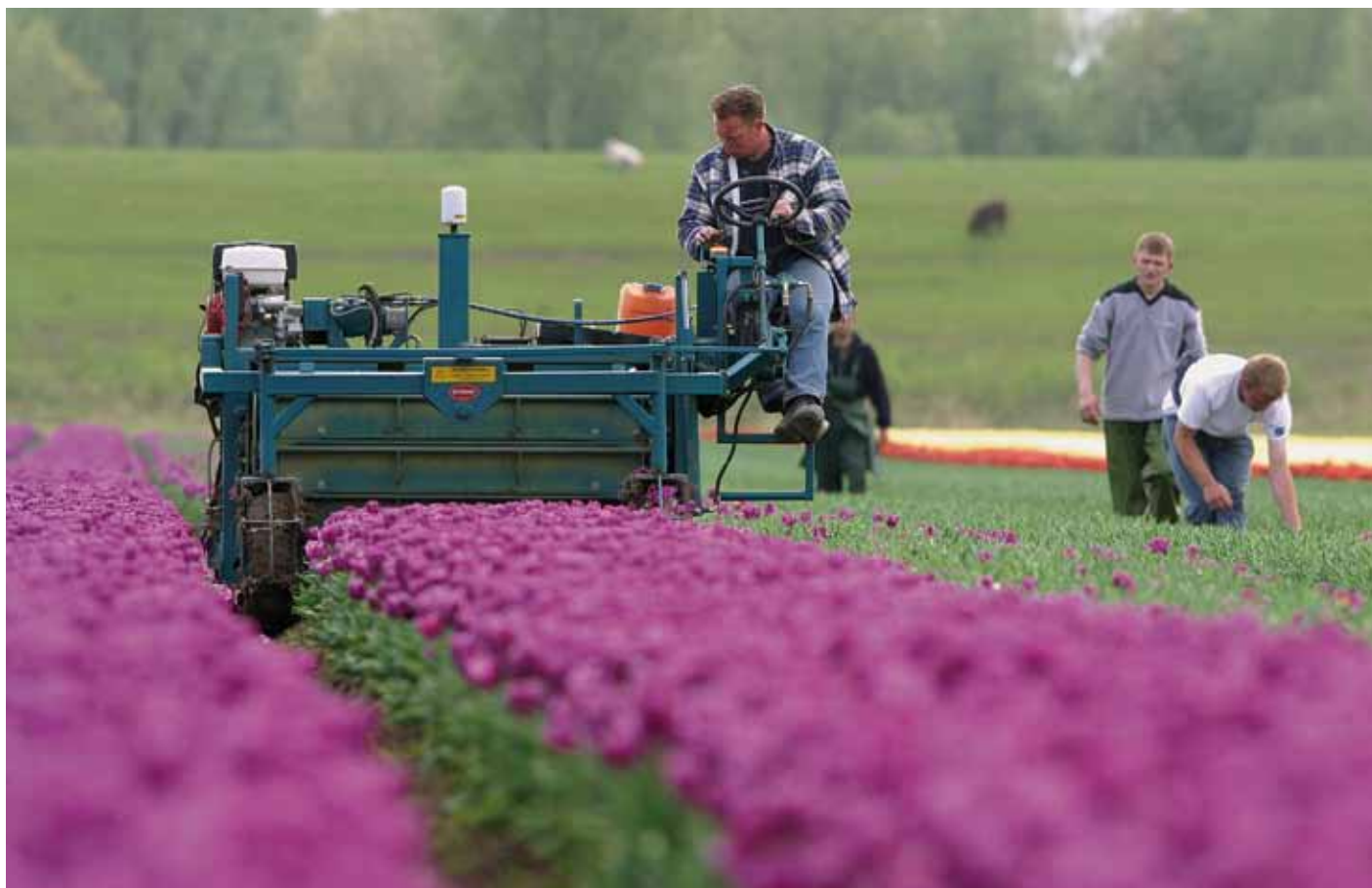
Het LEI gaat onder andere bij tulpentelers onderzoeken welke afwegingen ze maken bij het voorkomen van de verspreiding van plagen.