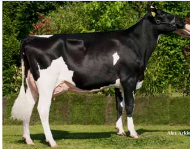
Mariegold (v. Goldwyn), 1a in rubriek 1 Voorspelde productie: 2.03 305 8452 3,92 3,37