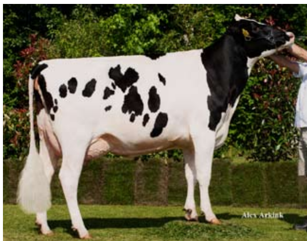
HBC Shottle Roza (v. Shottle), 1a in rubriek 2 Voorspelde productie: 2.05 305 8759 3,65 3,29