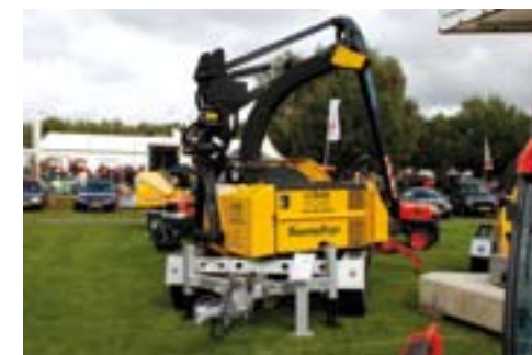
Zware Schliesing versnipperaar.