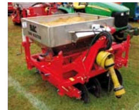
Blec Sand Injector.