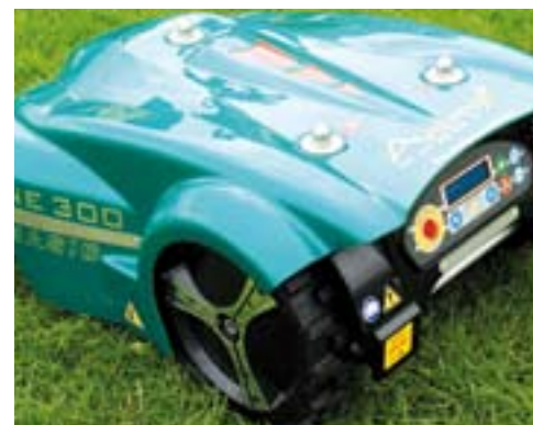
Jensen A540 versnipperaar.