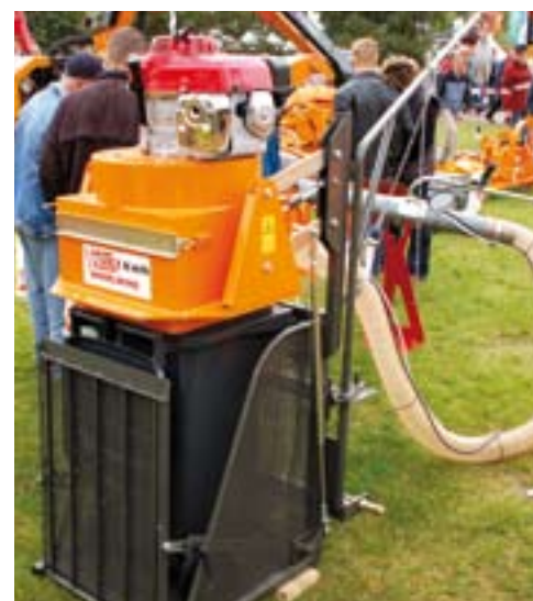
Votex Pluto 120-S XP.