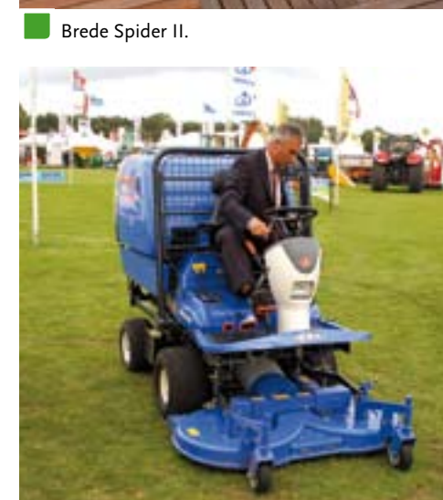
Iseki SFH 240 met opvang.