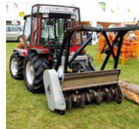
Brede Progressive cirkelmaaier.