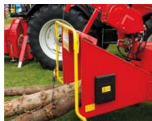
TP versnipperaar met lier.