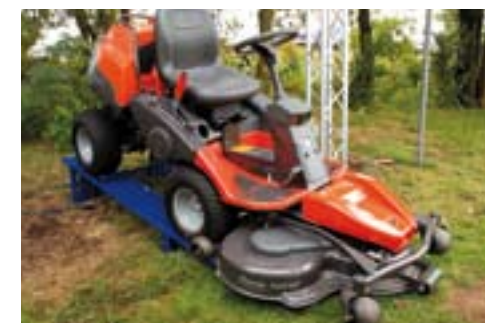
Husqvarna Riders verbeterd.