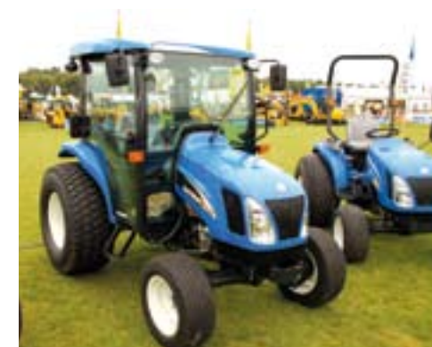
New Holland TCDA met eigen cabine.