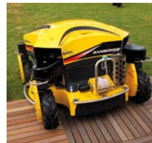
Brede Spider II.