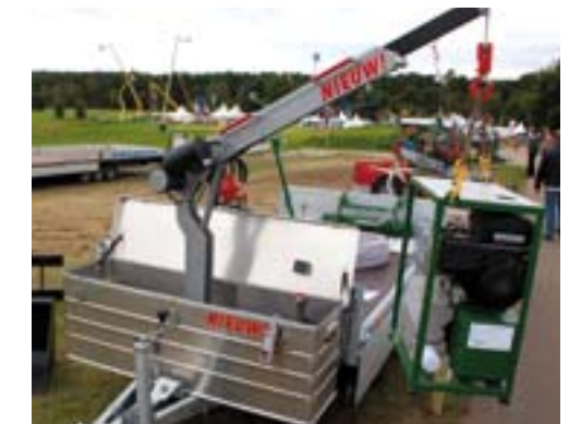
Kraan op aanhanger.