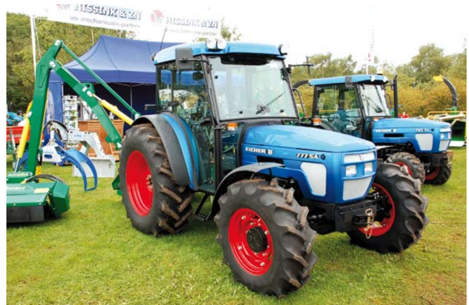
Eicher weer te koop.

Van Jo Beau is er nu ook een stobbenfrees, bleek bij Van der Klugt Groentechniek op de stand. De Pro-Grinder B31-07 staat op rupsen en kun je volledig automatisch laten werken. De maximum maat stobbe is 110 cm breed en 40 cm diep. Hij freest dan elke keer 7 mm weg met verstelbare cupbeitels. Ook kun je de machine handmatig bedienen. De aandrijving is door een 23 kW (31 pk) B&S met dubbele aandrijfpomp. Hij is 75 cm breed en 220 cm lang. De bedieningsarm is opzij te draaien. Handig is een opslag voor een jerrycan benzine. De prijs is 17.000 euro.