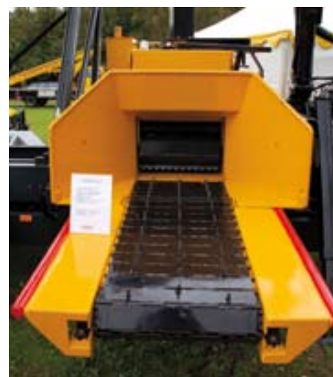
Zwaardere Ambrogio robotmaaier.