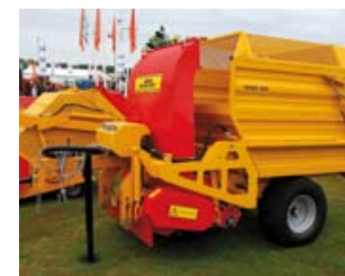
STH Panda 1404 maai/veeg/zuigwagen.