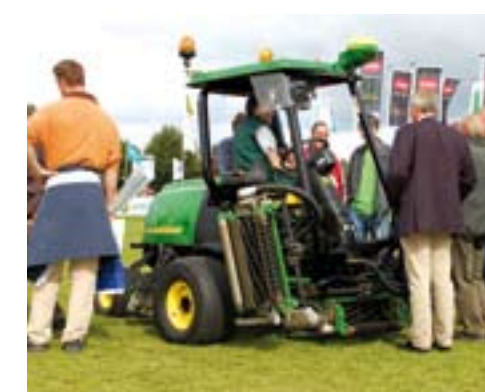
John Deere maaier met GPS.