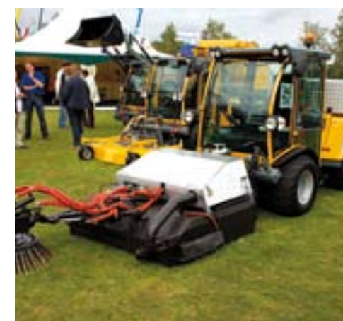
Belos met speciale Hoaf brander.