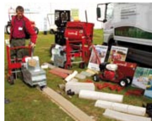
Betonnen borderranden leggen.