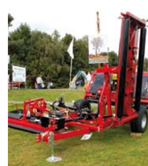
Brede Progressive cirkelmaaier.