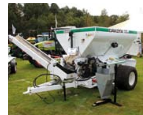
Dakota 440 zanddresser.