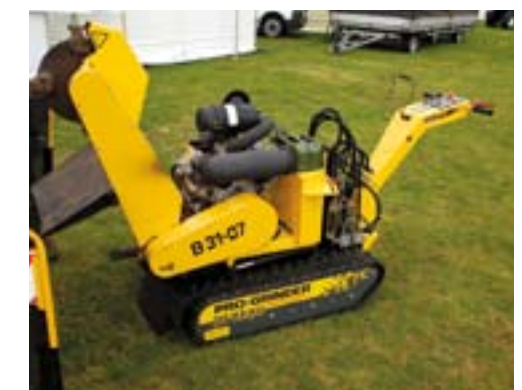
Jo Beau stobbenfrees.