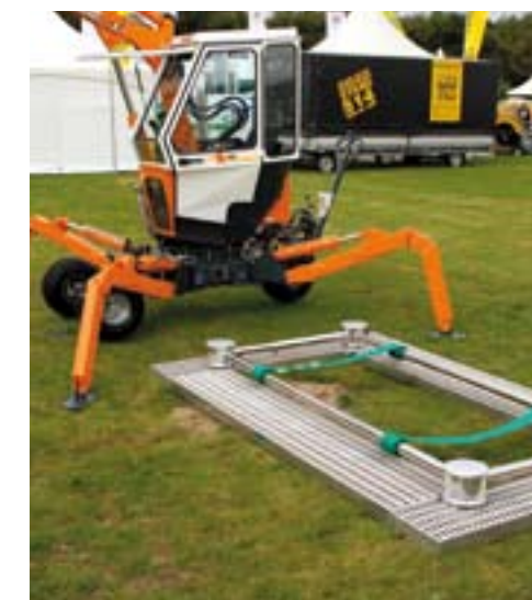
Junkins Superior graflift van RVS.