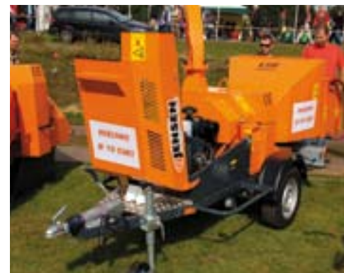
Kleinere FAE bosfrees.