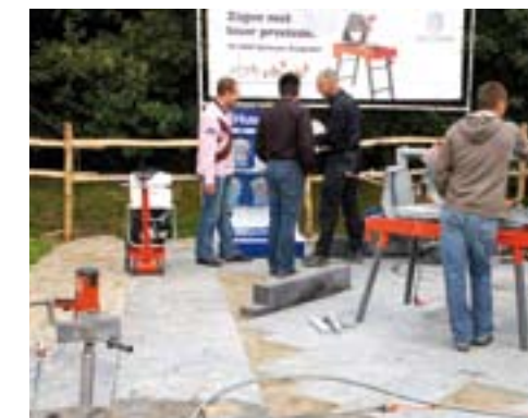
Bestraten met Husqvarna.