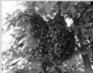
Een zwerm in de heg

de wolk werd kleiner en kleiner, totdat bijna alle bijen aan de twee trossen vastkleefden. Vervolgens kon Wim laten zien hoe je zo'n zwerm kunt scheppen: een korf om de tros houden en dan even flink aan het takje schudden.