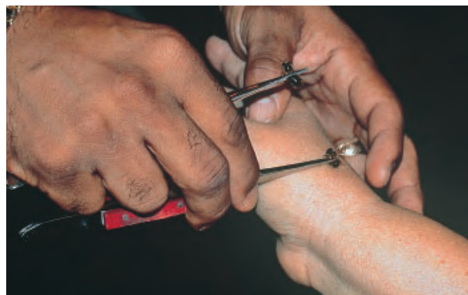
Bij wordt op hand geplaatst