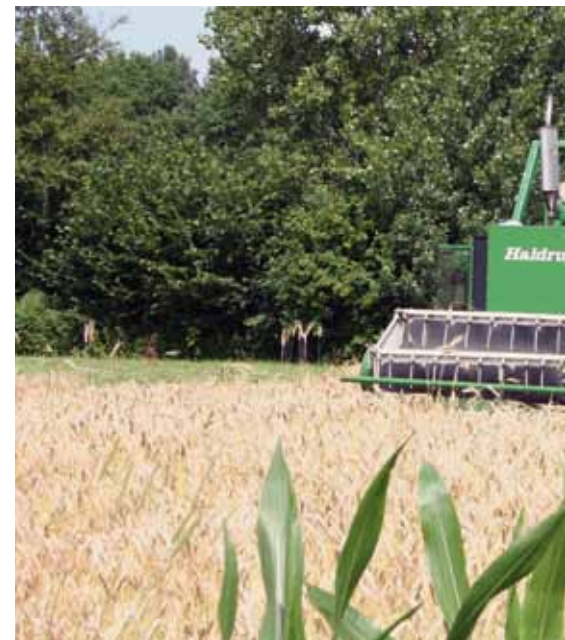
Sommige extensieve bedrijven telen hun eigen krachtvoer in de vor

In de biologische veehouderij is het regel dat koeien worden geweid. Door omstandigheden (weer, bodem) kan dat in Nederland niet het jaar rond. Hoogwaardig, energie- en eiwitrijk gras moet daarom worden geconserveerd voor de periode dat de koeien op stal staan of om als aanvulling op het weidegras te dienen, bijvoorbeeld in voorjaar en herfst. Inkuilen van gras kost o.a. arbeid en plastic en geeft bovendien verliezen waardoor de kwaliteit van ingekuild ruwvoer vaak minder is dan van vers gras. Op de meeste biologische melkveebedrijven hebben de koeien nog een gespreid afkalfpatroon waarin ze het hele jaar door afkalven omdat dat arbeidstechnische en economische voordelen heeft. Op een groeiend aantal biologische melkveebedrijven die de koeien zoveel mogelijk vers gras willen voeren verschuift het afkalfpatroon sterk naar het voorjaar. De top van de melkproductie valt dan samen met de top van de vers gras kwaliteit waardoor minder krachtvoer nodig is. Ook in het najaar kan langer geweid worden zonder bijvoeding. Doordat weidegras rijk is aan meervoudig onverzadigde vetzuren heeft de melk in