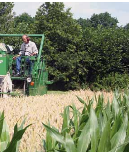
m van granen