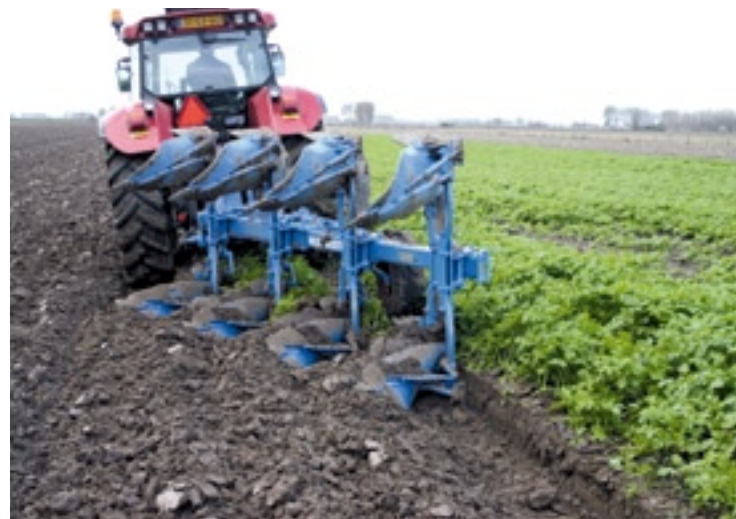
▲ De risters hebben een goede kerende werking, de sneden sluiten netjes aan.