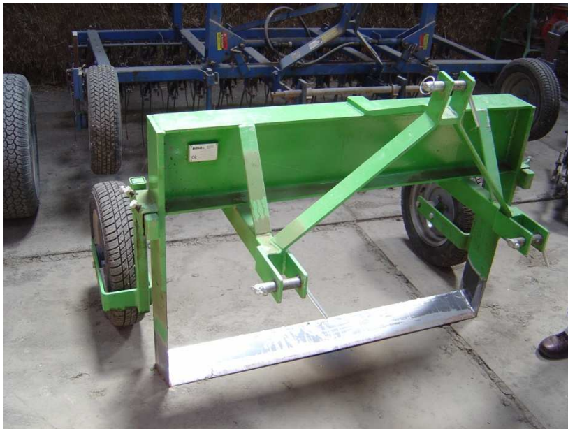
Figuur 1. Mes voor wortel snijden

Wortel snijden, hoe gebeurt dat? Dit is simpelweg dat er een mes onder de onkruiden door wordt gehaald in dit geval op 15cm diepte. Mes zie figuur 1.