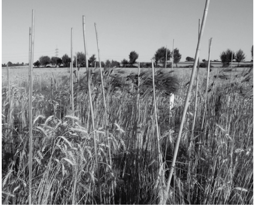
Als het gaat om graanveredeling spelen binnen de biologische landbouw de biologisch-dynamische bedrijven een voortrekkersrol. Hier graanveredeling op BD-bedrijf Dotterfelderhof, Duitsland.

Wat is het eigene van de F1 hybriden? Op twee niveaus wil ik dat bespreken.