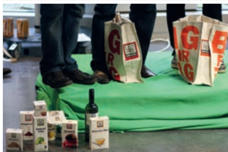
Kloppen de prijzen die de debatdeelnemers voor fair-trade-producten in gedachten hebben?

En, hoe interesseer je de consument voor fairtrade-producten? De prijzen liggen immers hoger. Maar ze liggen lang niet zo hoog als de meeste mensen denken, zo blijkt bij een prijzeninventarisatie.