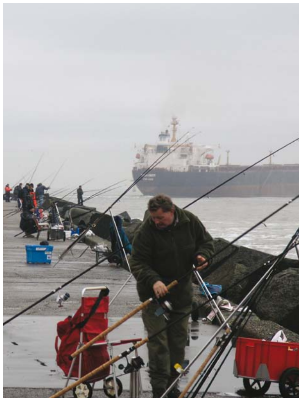
Zeesportvisserij is een van de belangrijkste vormen van openlucht recreatie.

Algemeen uitgangspunt voor de sportvisserij is dat men erkend wil worden als stakeholder in het GVB en uiteraard in evenredige wijze wil kunnen bijdragen aan verbetering van de visstand. Mocht bij de herziening in 2012 het GVB meer op regionaal niveau gaan plaatsvinden, dan zal er ook uitdrukkelijk aandacht moeten zijn voor een goede representatie van de zeesportvisserijbelangen. Dat vereist een grote inhaalslag bij een aantal lidstaten, waaronder Nederland. Het Groenboek en de herziening van het GVB per 1/1/2012 bieden daarvoor een mooi aanknopingspunt. V