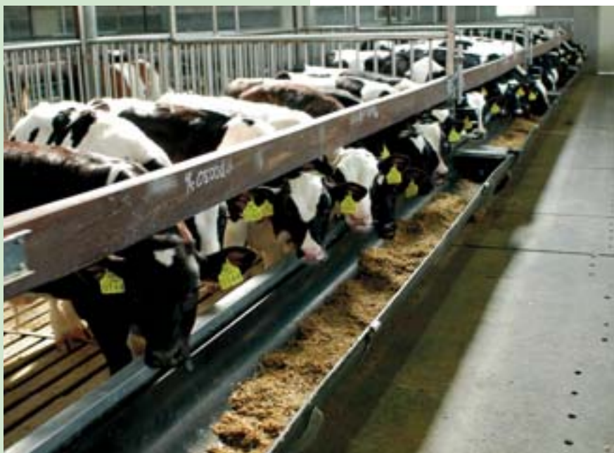
In de kalvesector vindt schaalvergroting plaats; kalverhouders besluiten nieuwe stallen te bouwen

De uitvinding van de kunstmelk in 1955 markeerde de groei van de kalvesector. De melkpoeder kostte slechts de helft tot een kwart van wat toen de volle koemelk opbracht. Steeds meer bedrijven gingen zich toeleggen op het houden van kalveren. De witvleessector werd een zelfstandige branche en was geen bijzaak meer van de melkveehouder. Niet alleen het aantal kalverbedrijven steeg, ook het aantal kalverplaatsen per bedrijf nam toe.