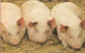
Dieren in de Comfort Class-stal hebben een apart ligbed en een aparte mestplaats. Varkens zijn zindelijk en houden hun ligplek schoon en droog.