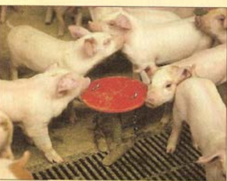
Afleidingsmateriaal leidt tot minder gevechten. Deze paddenstoel is eenvoudig op de roosters te monteren.