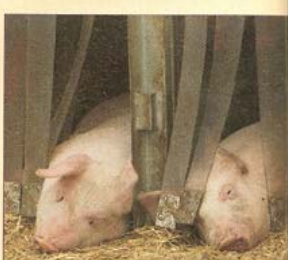
De plastic flappen voor de groepsbedden bieden een beschutte en veilige ligplaats.