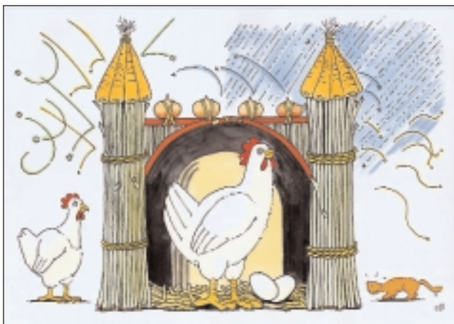
Robuustheid als bescherming

Robuustheid van het dier gaat over eigenschappen die wenselijk zijn aan dieren (tolerantie, aanpassingsvermogen) en over maatschappelijke zorgen rond dieren (kwetsbaarheid door druk van buiten en door de productiviteit).