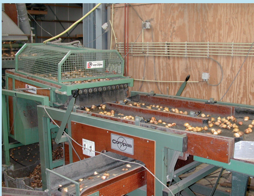
De pelmachine is niet bij iedereen de oorzaak voor toename van zuur.